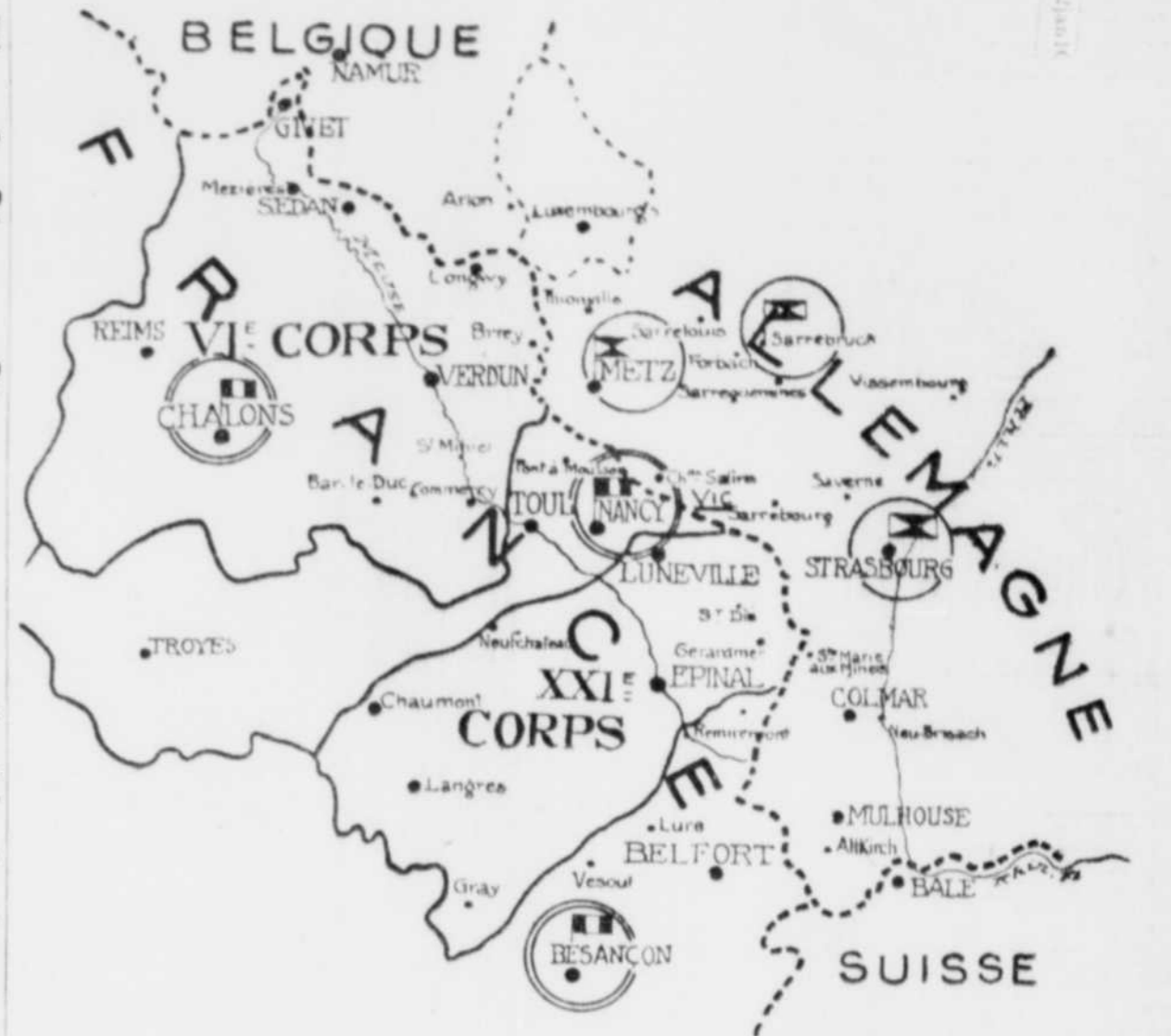
Carte des corps d'armée français et allemands en présence à la frontière. Les troupes françaises ont pénétré en Alsace et occupent Vic, et Moyen Vic, à l'est de Nancy.