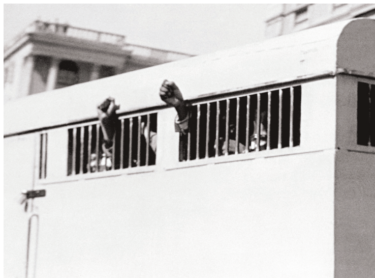
Le 16 juin 1964, huit hommes condamnés à la prison à perpétuité, parmi lesquels se trouvait Nelson Mandela, lèvent le poing en signe de défiance à leur sortie du palais de justice de Pretoria.

de l'Homme », dit-il en entretien. « Au début, on l'a trouvé dans la continuité des grands libérateurs qui combattaient auprès de rébellions armées pour lutter contre le pouvoir oppressif. Mais, à partir de sa libération en 1990, il est passé à une gestion des droits de l'Homme pacifiée, universaliste et réconciliatrice, analyse M. Massias. De ce point de vue, il est l'héritier de la lutte pour les droits civiques au XX e siècle, tout en inaugurant un nouveau type de gouvernance des droits de l'Homme qui