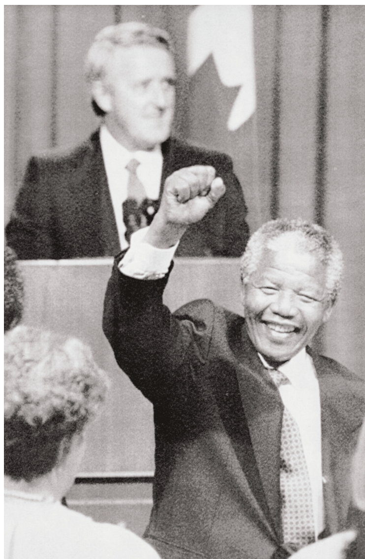
Alors vice-président du Congrès national africain, Nelson Mandela est présenté par le premier ministre canadien, Brian Mulroney, lors d'un dîner organisé en son honneur à Toronto, le 18 juin 1990.