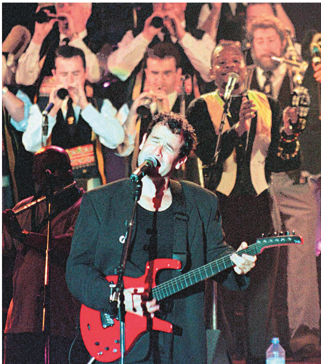
Johnny Clegg, le Zoulo blanc, a cofondé en 1979 Juluka, le premier groupe multiracial en Afrique du Sud. Sur la photo, Clegg sur scène en France, en 1997.