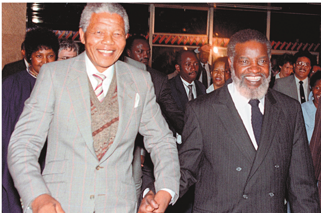
Mandela et Sam Nujoma, nouvellement élu président de la Namibie, alors que commençait les célébrations de l'indépendance de la Namibie en mars 1990. Le pays était sous l'emprise de l'Afrique du Sud depuis 1919.

Quand l'occasion s'est présentée aux médias et aux journalistes de faire autre chose que la couverture des conférences de presse offi-