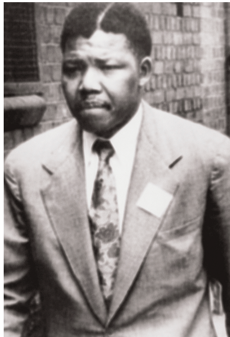
Nelson Mandela, membre du Congrès national africain, en 1961, quelques années avant d'être accusé de conspiration.