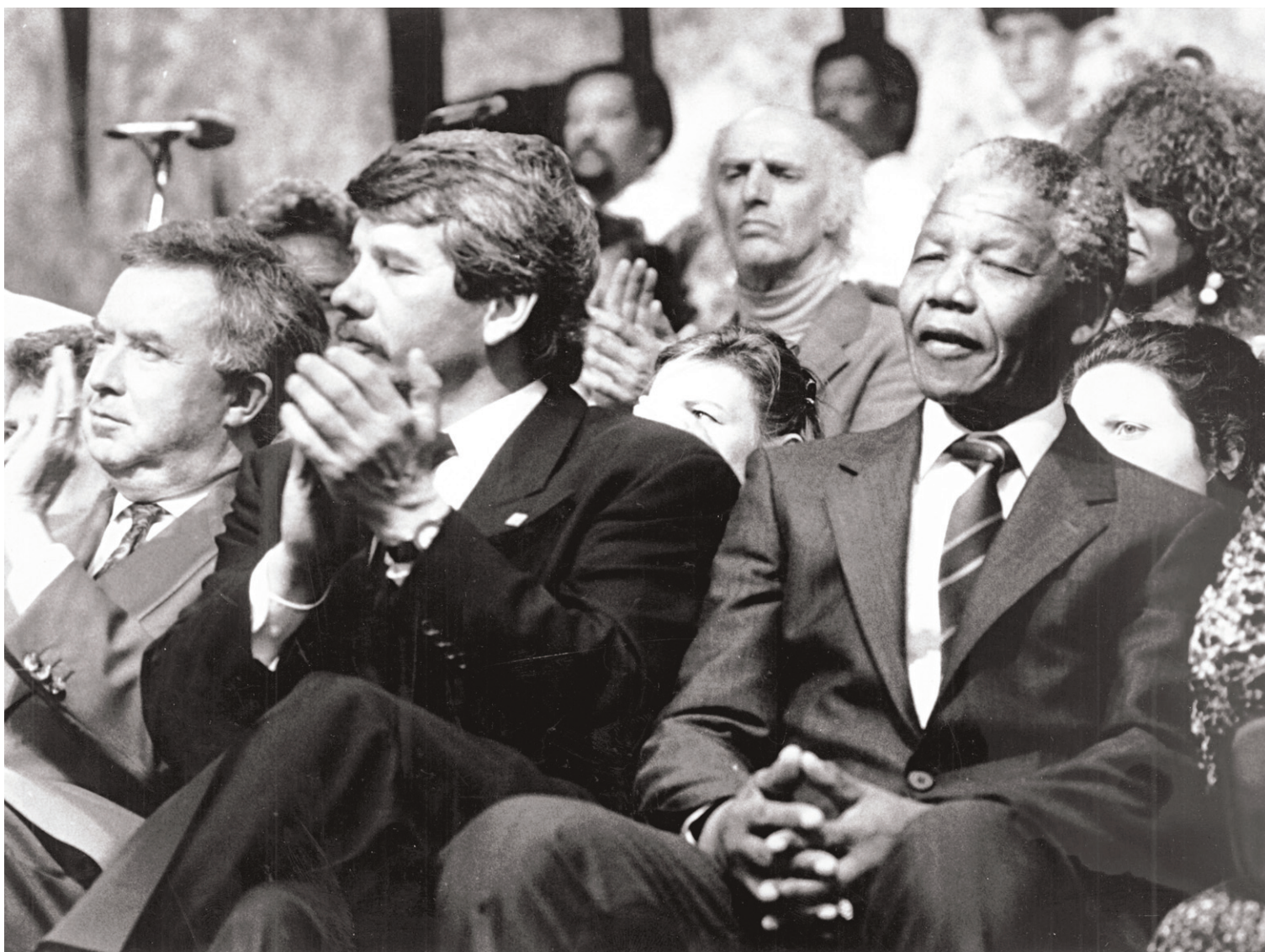
Nelson Mandela en compagnie du maire de Montréal, Jean Doré, du ministre des Affaires étrangères du Canada, Joe Clark, et de Gilles Vigneault, à Montréal, le 19 juin 1990.