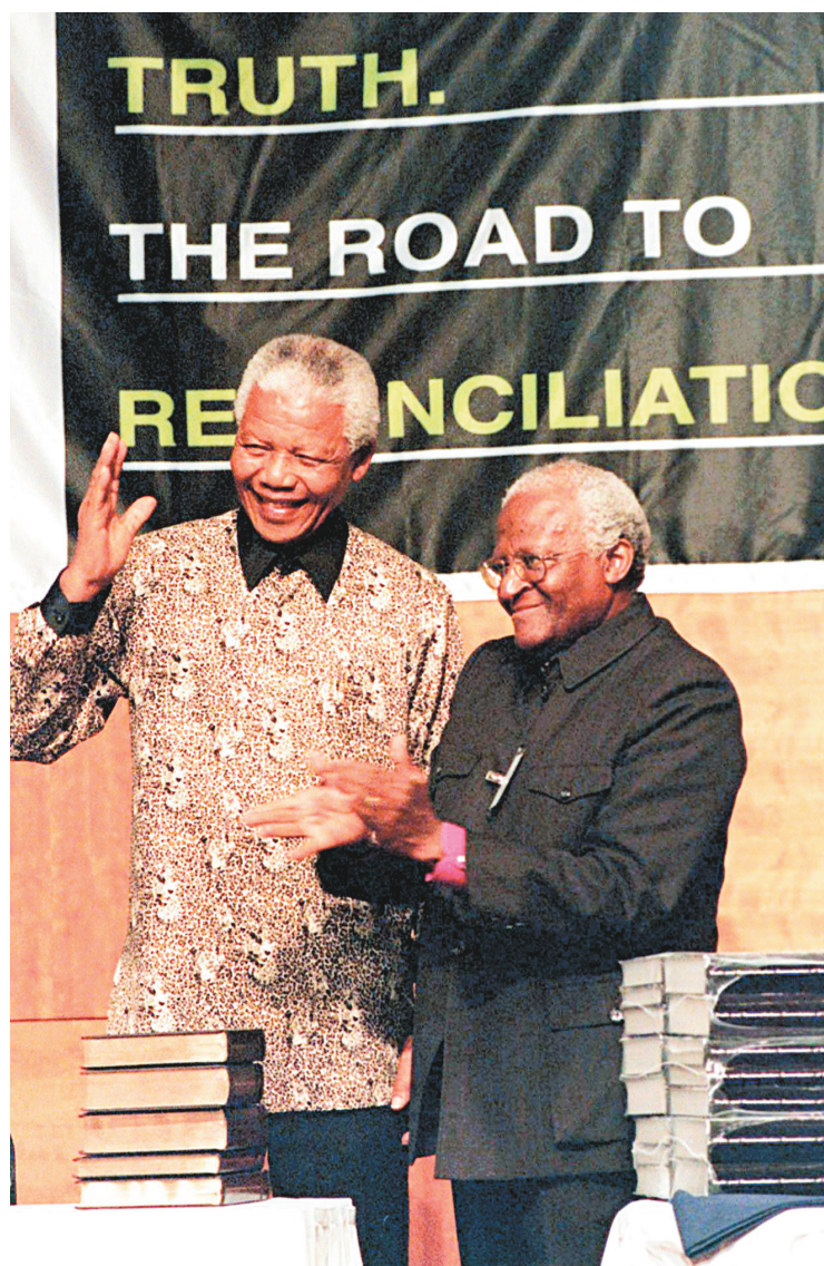
Des mains de l'archevêque anglican sud-africain Desmond Tutu, le président Mandela reçoit en octobre 1998 le rapport final de la Commission vérité et réconciliation.