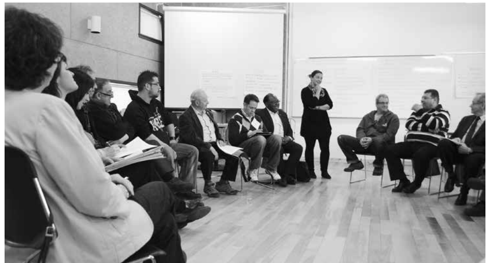
Quelques participants à l'étape 1 de la planification stratégique régionale.

Rappelons que la planification possède son propre site Internet interactif et dynamique ainsi que sa page Facebook. Les acteurs et personnes intéressées par le développement de la région peuvent s'y inscrire et être tenus informés de toutes les activités en lien avec la planification, des ajouts au site, etc. À noter que le logo et la trame graphique du site changent de couleur au gré des étapes, venant notamment de quitter le rose pour adopter l'orangé tout l'automne.