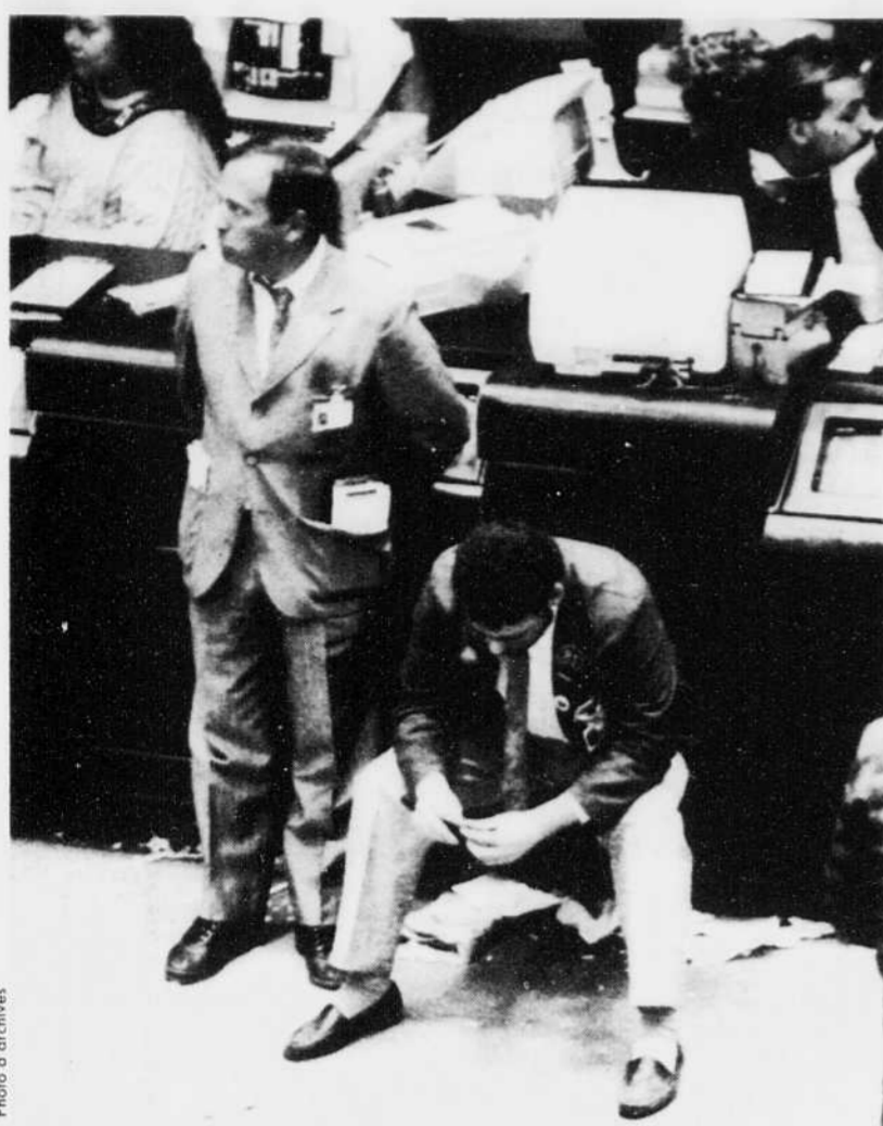
Les experts de la bourse sont étonnés: depuis plusieurs semaines, les indices des bourses de New York et Toronto vont sans contrainte et rien n'indique que la situation pourrait changer.