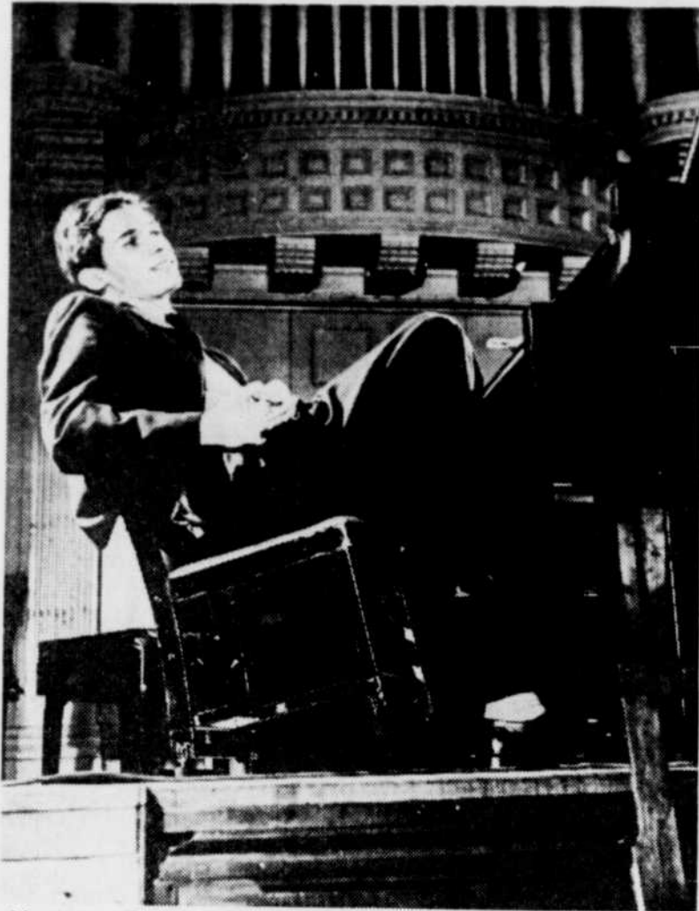
L'auteur allemand Thomas Bernhard (à droite) s'est inspiré du génie du pianiste Glenn Gould pour rédiger une réflexion tourmentée sur la création. "Le naufragé" est un roman philosophique, et non une biographie: avis aux "fans" de Gould!

"Mais la circonstance de mon échec ne m'oppressait pas comme elle oppressait Wertheimer qui a souffert sa vie durant et jusqu'au bout d'avoir renoncé, de s'être adonné aux sciences humaines dont il n'a pas su jusqu'à la fin ce qu'elles étaient réellement, de même que je ne sais pas, à ce jour, ce qu'est la chose philosophique, voire la philosophie en général. Glenn est le triomphateur, nous sommes les perdants." Mais tout au long du roman, on ne saura jamais précisément si ce livre est écrit à la mémoire de Wertheimer (qui s'est suicidé) ou en hommage au génie de Glenn Gould.