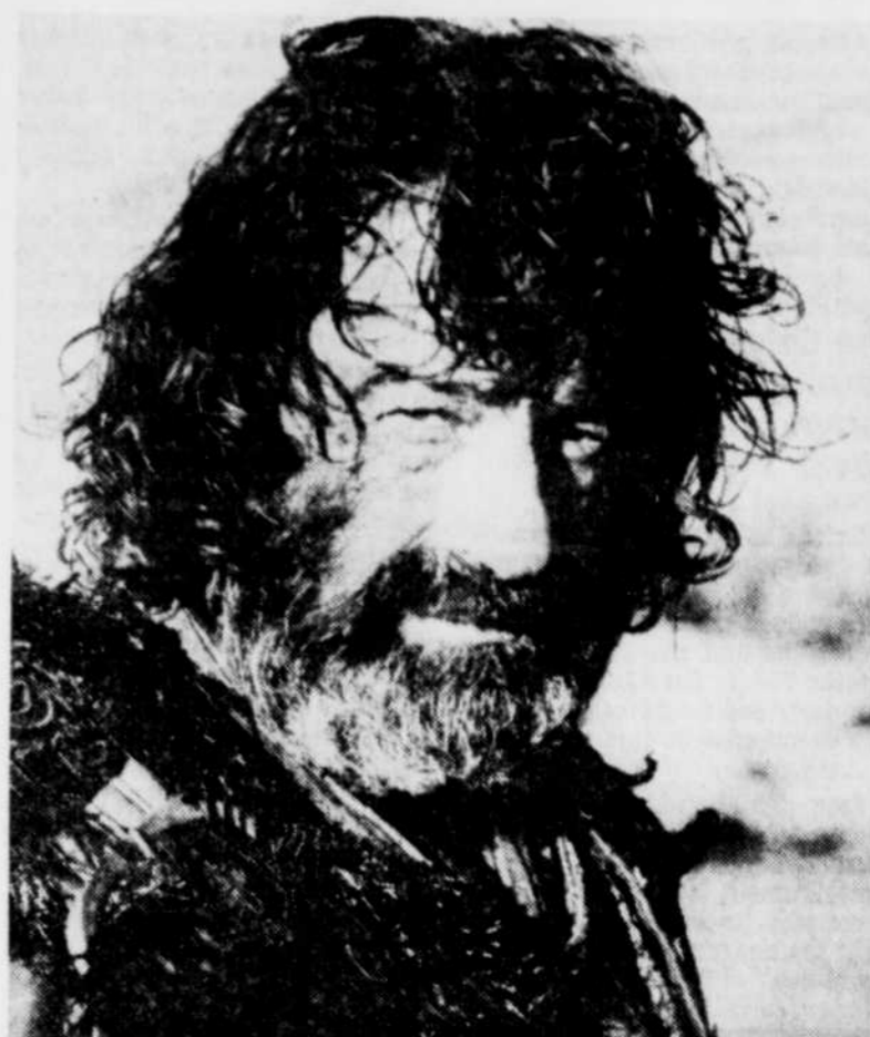
Walter Matthau (capitaine Red), le plus cruel des Frères de la côte, tel que filmé par Polanski dans "Pirates".

Le scénariste Gérard Brach résume bien le film de Polanski: "Je préfère de beaucoup l'aventure de gens en radeau perdus sur la mer à celle de cosmonautes se bagarrant dans l'espace. Il y a plus de mystère dans le fond des mers que dans l'infini du cosmos..."