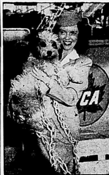
Récemment, une caniche du nom de Mandy, voyageant de Londres à Vancouver, à bord d'un avion d'Air-Canada, profita d'une courte escale d'une heure à Goose Bay, Labrador, pour s'esquiver et visiter les bois.

Mandy secoua son collier si fortement qu'elle parvint à s'en détacher et à se sauver à l'insu de tous. Mais quelques minutes plus tard, lorsqu'on s'aperçut de sa fuite, les recherches commencèrent. Mandy courait si fort qu'il fut impossible de la capturer.