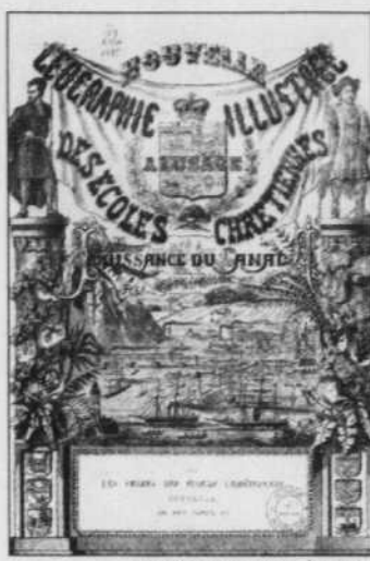
Nouvelle géographie illustrée à l'usage des écoles chrétiennes, un «vieux» manuel scolaire appartenant à la collection de la bibliothèque de l'université Laval.