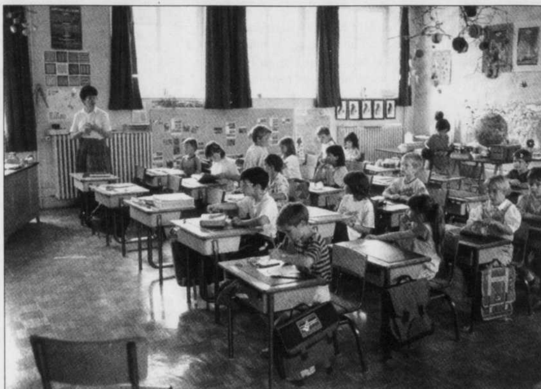
Une classe du primaire en Alsace.

Même si elles ne sont pas encore soutenues financièrement par l'État français, des ressources sur Internet