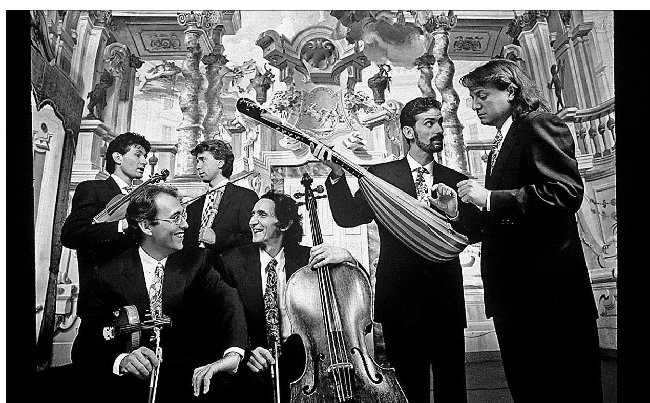
Il Giardino Armonico, réputé ensemble baroque de Milan, sera en concert ce soir à la salle Maisonneuve de la Place des Arts.

BEETHOVEN: les 10 Sonates pour violon et piano. Élèves d'Eleonora Turovsky. Samedi soir, salle Claude-Champagne de l'Université de Montréal.