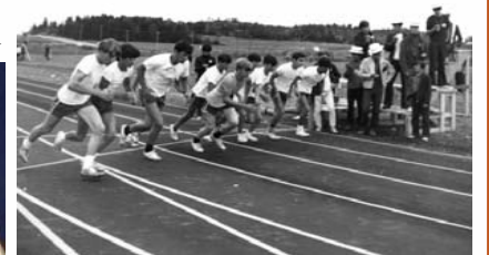
Les Premiers Jeux du Québec de 1971

Le mercredi 21 mai 2008 Hôtel Levesque de Rivière-du-