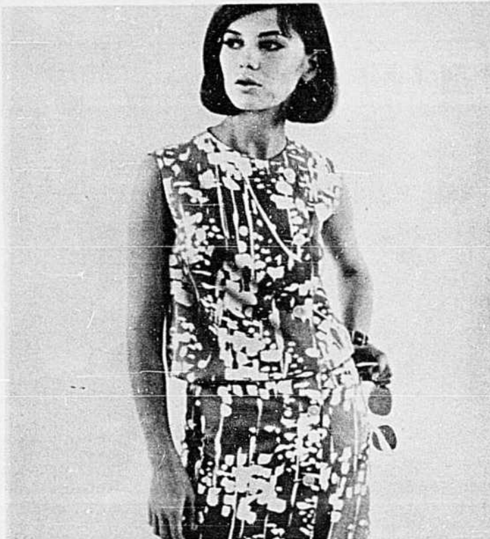
VOGUE 6218 Grandeurs 10-18 $1.65

Quoi de plus frais et de plus pimpant que cette robe à effet deux-pièces. Le corsage est blousant et la jupe droite, boutonnant sur le côté. La jupe donne de l'aisance, grâce à un pli le long des boutons. On peut la confectionner avec ou sans manches. Ce patron est en vente à la Lingerie Poirier et au Magasin Gosse-lin de St-Jérôme.