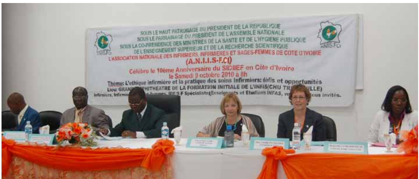
La journée de formation du 9 octobre 2010 à l'ANIS-FCI

Outre la conférence thématique, plusieurs activités ont également été organisées au cours de la semaine afin de promouvoir la profession infirmière en Côte d'Ivoire. Ainsi, des rencontres avec des groupes d'infirmières et d'infirmiers de la Côte d'Ivoire mais également avec le Ministre de la Santé ont été des occasions de discuter des divers enjeux de la formation infirmière au sein de la Francophonie et plus particulièrement en Côte d'Ivoire. ☺