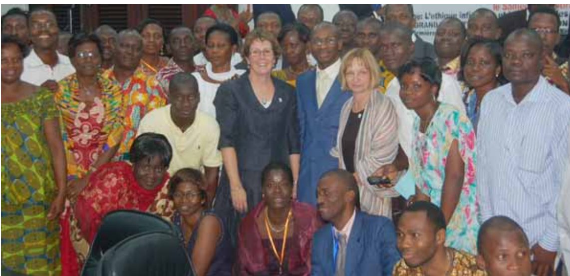
Le groupe de participants à la journée de formation du 9 octobre 2010