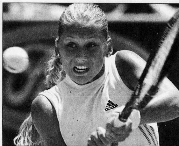
La Russe Anna Kournikova a sorti son retour canon contre son adversaire Barbara Schett, qu'elle a battue 2-6, 6-4, 6-3.