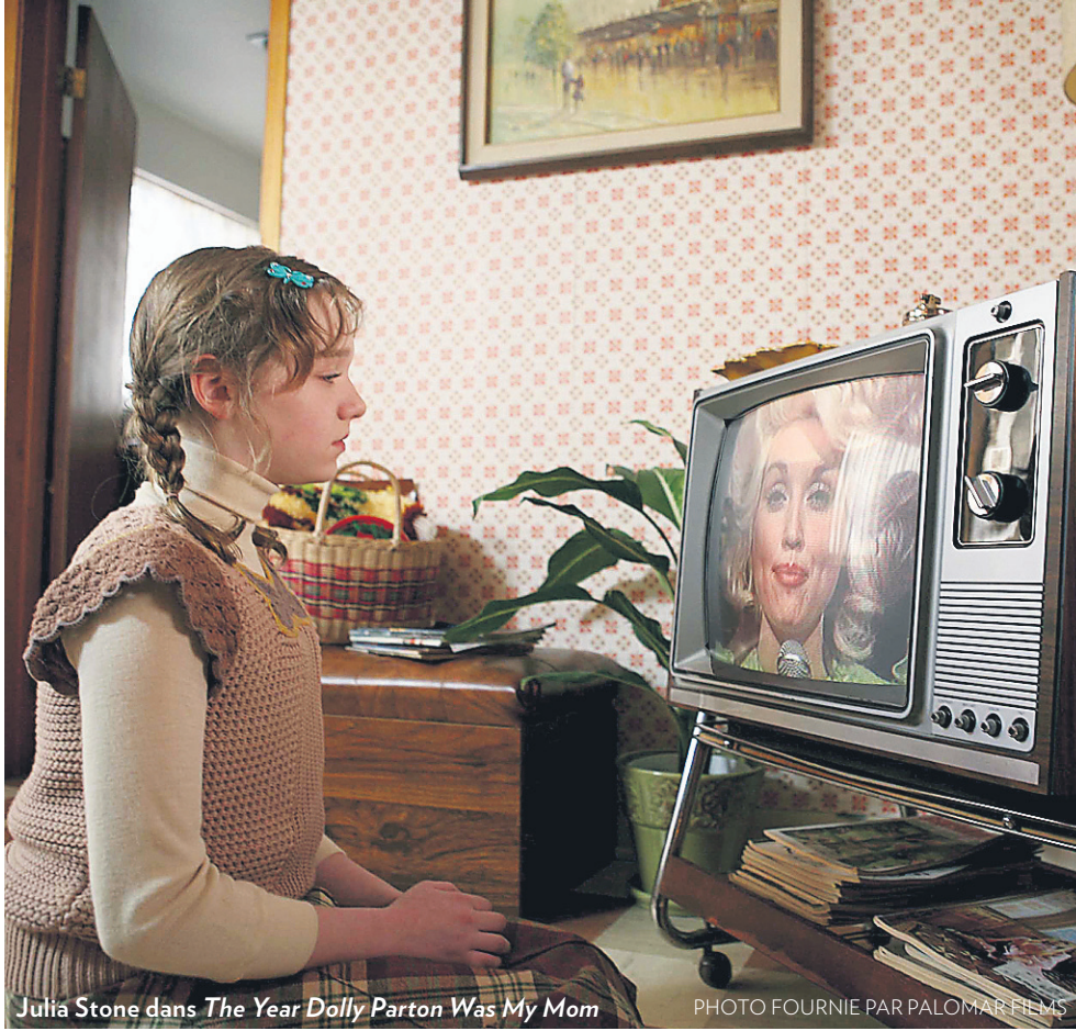
Julia Stone dans The Year Dolly Parton Was My Mom