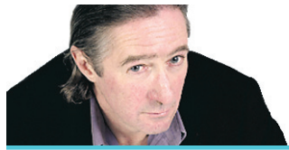
LOUIS-BERNARD ROBITAILLE COLLABORATION SPÉCIALE

L'auteur de Fanfan cause une polémique en revisitant la figure de son grand-père, ancien chef de cabinet du plus collabo des hommes d'État français, Pierre Laval.