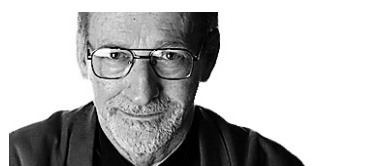
CLAUDE GINGRAS MUSIQUE

C'est encore une semaine tranquille côté concerts, les activités se ramenant à quatre expériences acoustiques nouvelles, initiatives de la Faculté de musique de l'Université de Montréal, à la salle Claude-Champagne, et à trois concerts d'un même programme Telemann-Fasch de l'Orchestre baroque Arion, au Redpath Hall de McGill.