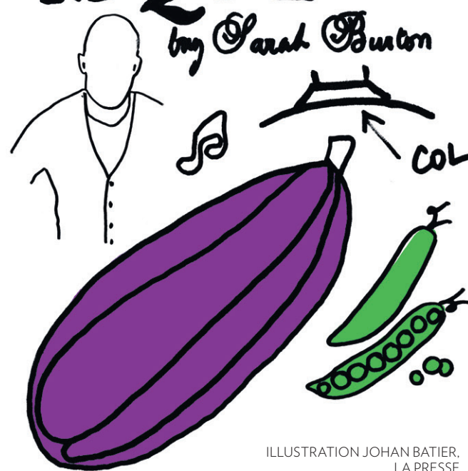
ILLUSTRATION JOHAN BATIER, LA PRESSE