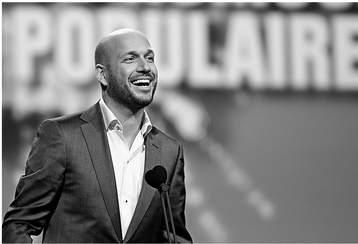
Le DVD du spectacle de Martin Matte arrive en tête du palmarès des DVD québécois les plus populaires.