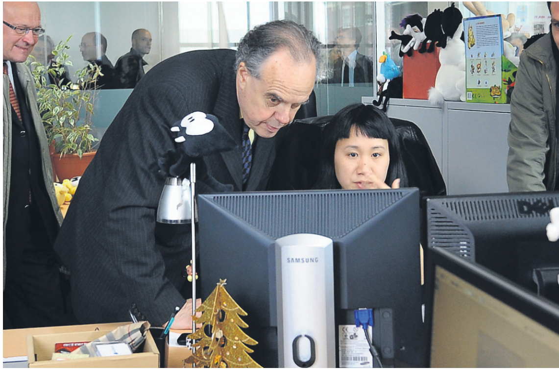
Le ministre de la Culture et de la Communication, Frédéric Mitterrand, a décidé d'agir contre le téléchargement illégal.

Il faudrait peut-être s'en inspirer au Québec. Comme nous le rapportons la semaine dernière, les Québécois achètent moins de musique en ligne – toutes proportions