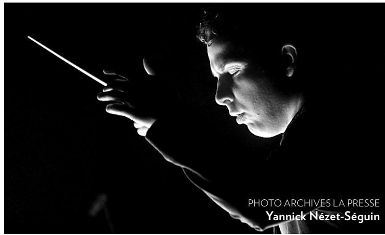
Yannick Nézet-Séguin