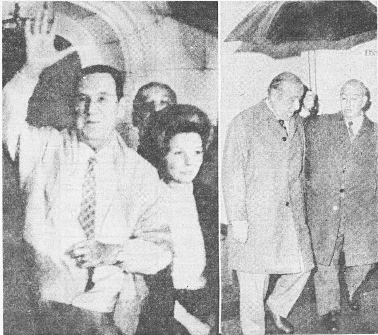
Le président de l'Argentine, M. Hector Campora (à gauche), quitte la demeure de Juan Peron, à qui il cède aujourd'hui la présidence en attendant de nouvelles élections. A droite, l'ancien président Peron salue ses partisans à la porte de sa résidence en banlieue de Buenos Aires.

Peron a eu de longs entretiens au début de la semaine avec les nouveaux commandants de l'Armée, de l'Aviation et de la Marine qui ont autorisé, hier, le président Campora à redonner le titre de lieutenant-général à Peron qui en avait été déchu lorsque les militaires le mirent à la porte de son pays.