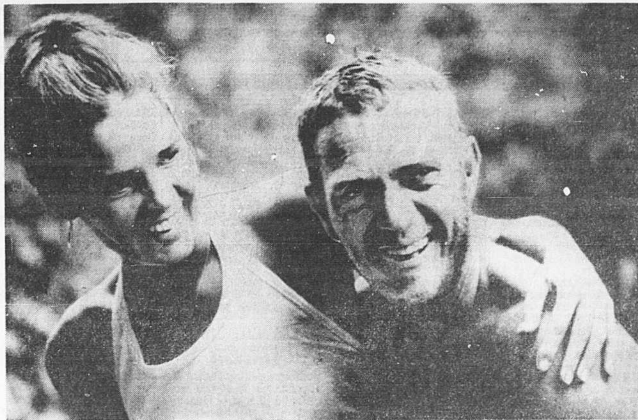
Steve McQueen a trouvé la deuxième femme de sa vie, la vedette du film "Love Story", Ali McGraw. Ils se sont mariés hier au Wyoming. Plus tôt cette année, Ali s'était rendue à la Jamaïque où Steve tournait son plus récent film "Papillon".

Signalons que le coût de l'achat de la caravane d'une valeur de $32.000 a été payé par les Clubs Lions Weston et Parkdale de Toronto et que les frais d'opération seront défrayés conjointement par l'Institut, la Fédération des médecins spécialistes, l'Association des ophtalmologistes et le Club de hockey canadien. Ces appuis financiers permettront à la clinique de parcourir l'Abitibi dès le mois d'octobre.