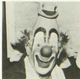
«Le Cirque Busch Roland». Numéros de cirque venant d'un peu partout dans le monde.

9h55 OUVERTURE ET HORAIRE 10h00 CLAK «Haut, bas». 10h15 LES HISTOIRES DE BENJAMIN «Les Mains sales». 10h30 CONSEIL-EXPRESS «Services gouvernementaux fédéraux». Mme Yvette Rousseau nous parle du Conseil du statut de la femme. 11h00 LES TROUVAILLES DE CLÉMENCE M. Alphonse donne sa recette de tarte aux pommes en quartiers. — M. Julien Fontaine fait un bref exposé de quelques herbes guérisseuses. 11h30 LES AVENTURES DE TOM SAWYER «Le Trésor de Joe l'Indien». Becky sauvée d'un danger imminent, l'Indien et son complice morts, Tom et Huch sont reçus triomphalement dans le village. 12h00 LE MONDE EN LIBERTÉ «Les Paléontologues des marais». Documentaire de Jack Kauffman. Prod. (version française): Via le Monde Canada Inc. 12h30 LA CUISINE D'AILLEURS Invitée: Mlle Kalpana Das propose un plat végétarien typique des habitants de l'Inde. Ceux-ci à cause d'un très grand respect pour les animaux, ne consomment que très peu de viande. 13h00 SUR DES ROULETTES De Rouyn. Coanimateur: Marc Rouleau. Réal.: Michel Plante. 13h30 ANIMAGERIE 14h00 LE CHAMPIONNAT DU MONDE D'ATHLETISME En direct de Dusseldorf, en République fédérale d'Allemagne. Première Coupe du monde d'athlétisme réunissant toutes les disciplines et regroupant les meilleurs athlètes du monde. Commentateurs: Richard Garneau, Serge Arseneault et Jo Maléjac. Réal.: Jacques Primeau et Julien Dion. 16h30 MAIGRICHON ET GRAS-DOUBLE «Maître Encause et Anita». 17h00 LES CIRQUES DU MONDE