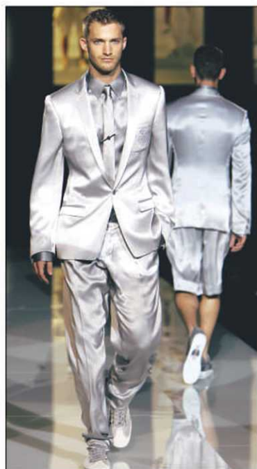
Les tissus argentés et dorés sont certainement la nouveauté du printemps.