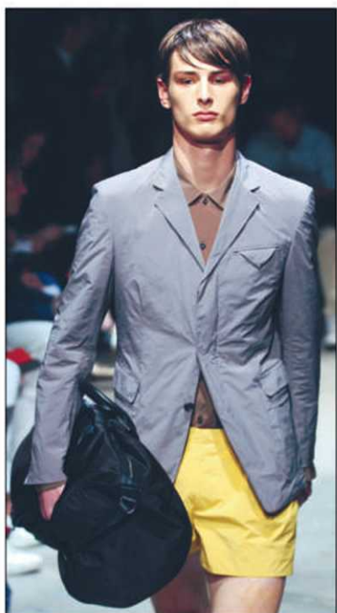
Prada agence le short jaune avec le veston gris pour une tenue sportive printanière.