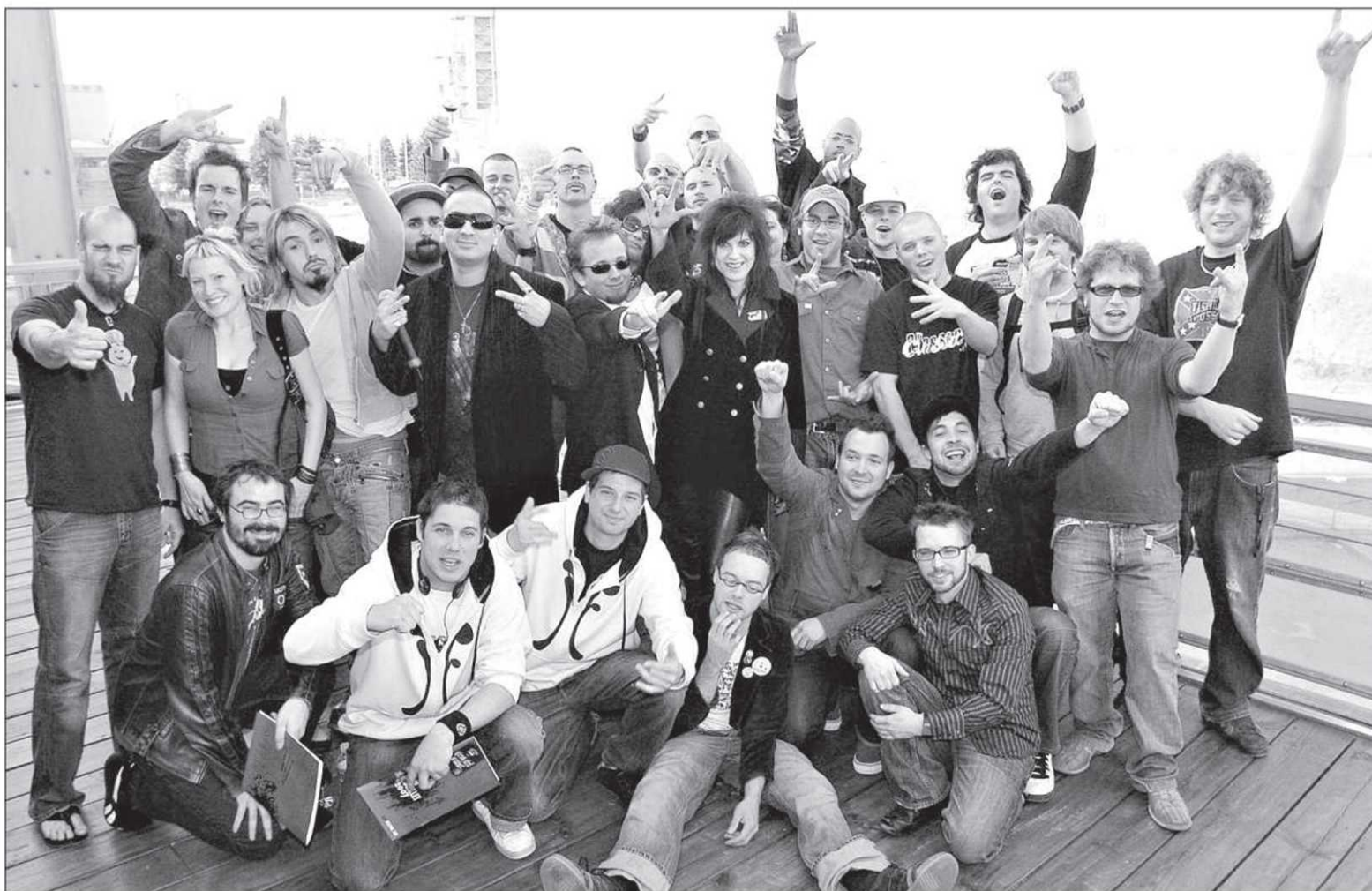
Un avant-goût des participants au 40 e Festival d'été de Québec