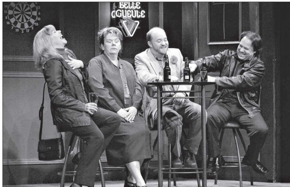
On rit de bon cœur dans cette comédie sans prétention.

Or, se pointer à un rendez-vous à l'aveuglette effraie nos deux protagonistes qui choisiront de se faire accompagner d'un chaperon. André y trimballe son ami Martin (Carol Cassinat), un morning man dans une station de radio, et Valérie emmènera Chantal (Marie-Christine Perreault), une policière qui multiplie les aventures sans lendemain. Le premier