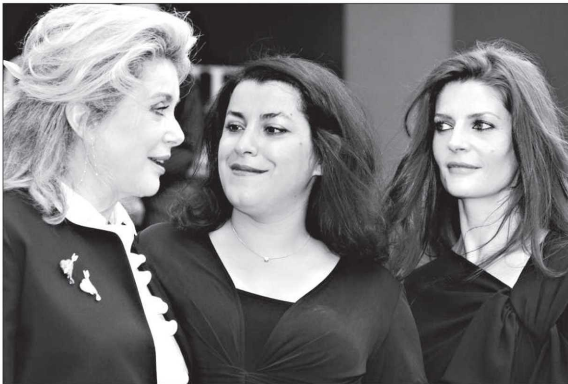
Catherine Deneuve et sa fille Chiara Mastroianni encadrent la réalisatrice Marjane Satrapi.

« La polémique, ce n'est pas ma tasse de thé, a-t-elle expliqué. Toute cette histoire n'est pas une affaire d'État. Il faut être capable de voir les deux côtés de mon film, surtout sa façon d'aller à l'encon-