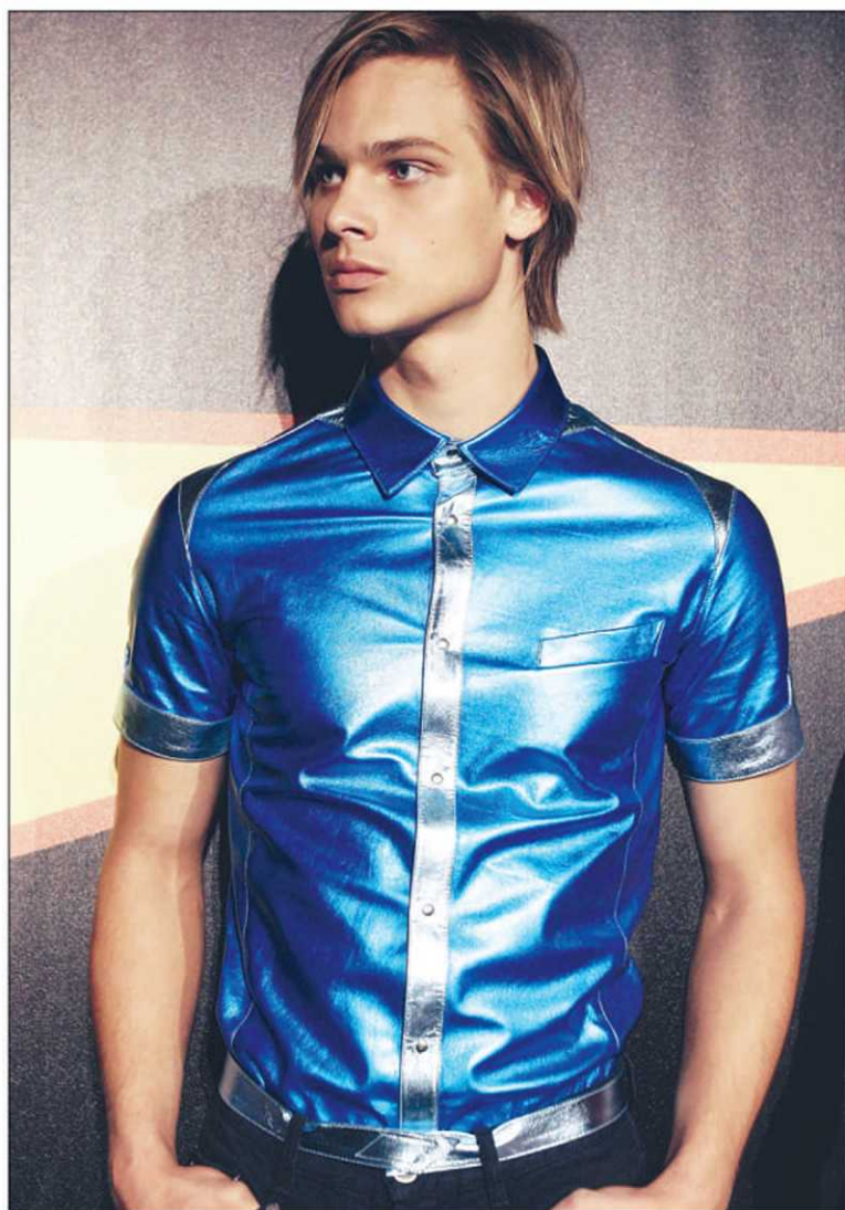
Une création toute en brillance pour la collection printemps-été 2007 de Thierry Mugler

Comment les porter : dans les boutiques huppées comme Colette à Paris, les fashionista s'arrachent les jeans de marques inconnues et abordables (80$). C'est