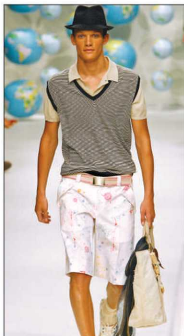
Moschino propose ce bermuda porté avec un débardeur couleur terre.