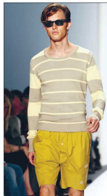
Pull à larges rayures sur bermuda décontracté de la collection John Bartlett