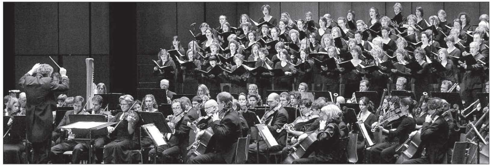
Yoav Talmi dirigeait hier soir l'Orchestre symphonique et le Chœur de l'OSQ.

Jean Lesage prend ombrage de l'impact de René Lévesque sur le public et au sein du Cabinet. 21 h à Radio-Canada