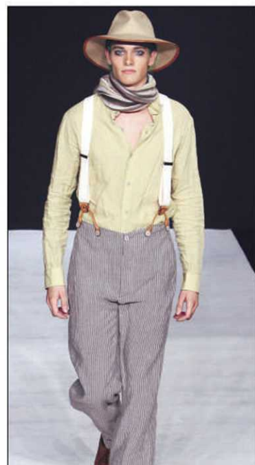
La proposition naturo-écolo de la designer française Agnès B