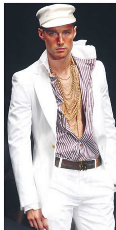
Les rayures se voient partout et se portent avec veston et pantalon blancs.

Comment les porter : il faut se méfier des tonalités de gris. Mal choisies, elles peuvent faire ressortir le gris de la barbe et donner un teint blafard. Préférez les gris lumineux dont la dominance est bleutée. Même chose pour le jaune. À moins d'avoir une peau foncée ou basanée, optez pour les jaunes contenant un soupçon de rouge. Ils donneront de l'éclat à votre teint.