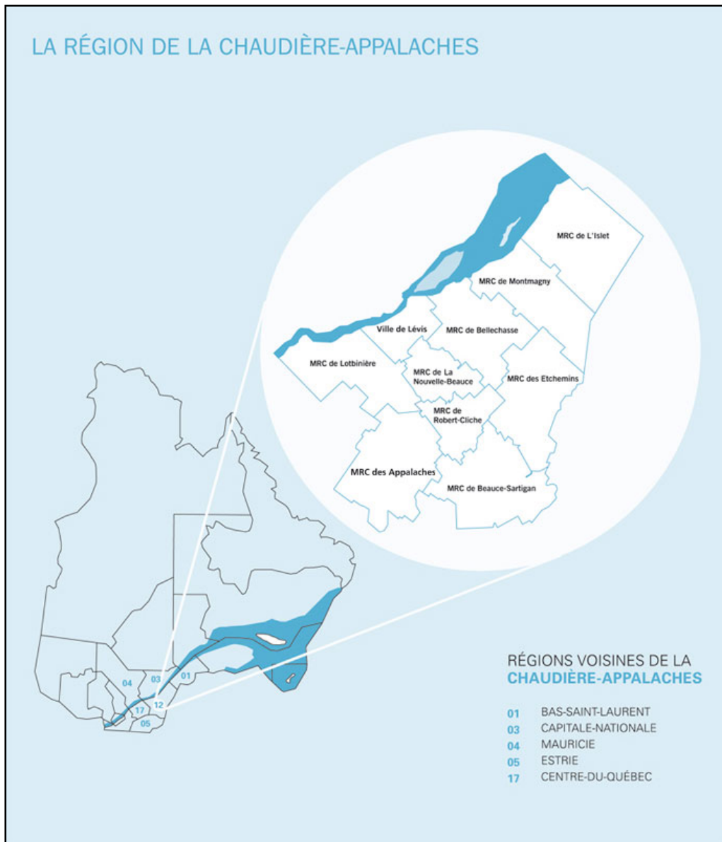
Figure 1 : Carte de la Chaudière-Appalaches

La région de la Chaudière-Appalaches compte une population de 403 011 1 personnes (2009), réparties en 136 municipalités regroupées en neuf municipalités régionales de comté (MRC) et un pôle urbain, Lévis.