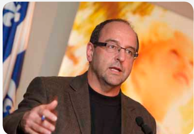
ALAIN POIRIER, DIRECTEUR NATIONAL DE SANTÉ PUBLIQUE