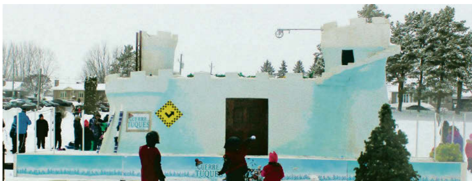
Fort Challenge.