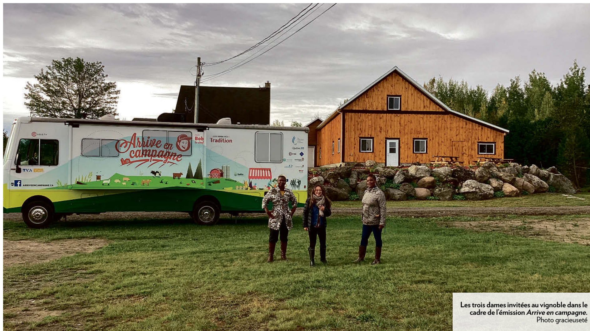
Les trois dames invitées au vignoble dans le cadre de l'émission Arrive en campagne .