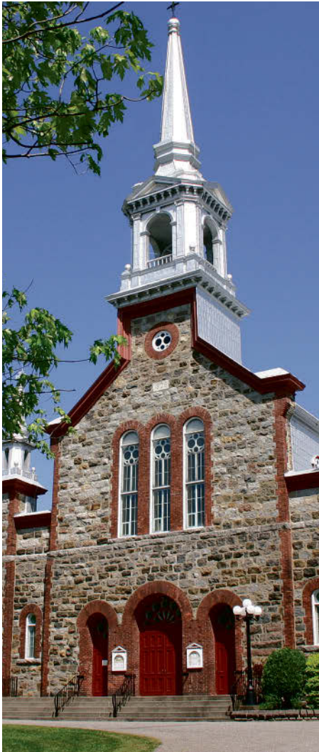
L'église de Racine.