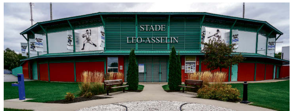
Le stade Léo-Asselin.