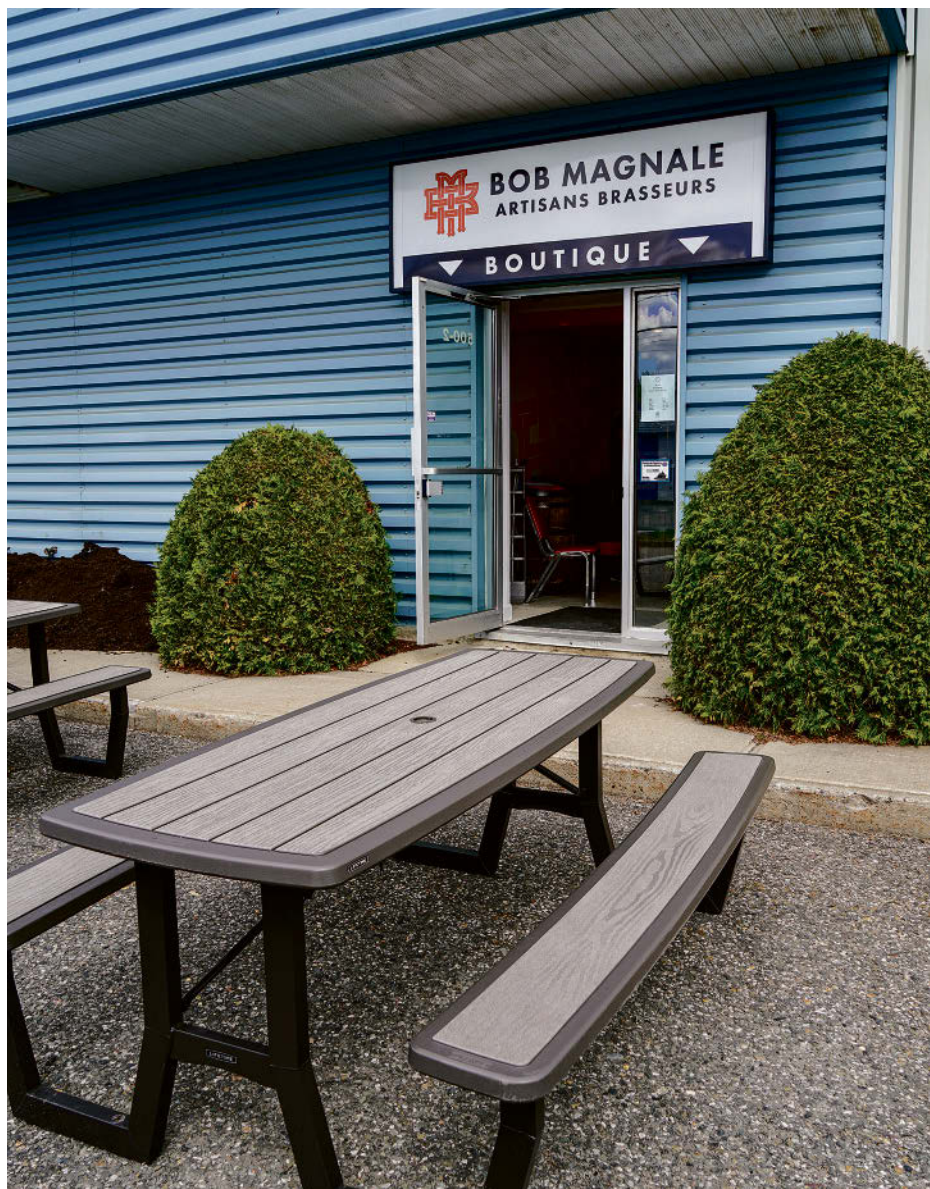
La bâtisse située sur la rue Bonin à Acton Vale.

Les amateurs de bières seront heureux d'apprendre que Bob Magnale Artisans Brasseurs pourrait, d'ici quelques mois, disposer d'un tout nouveau salon de dégustation intérieur de 75 places en occupant un plus grand espace dans son bâtiment actuel sur la rue Bonin à Acton Vale.