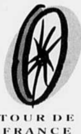
TOUR DE FRANCE