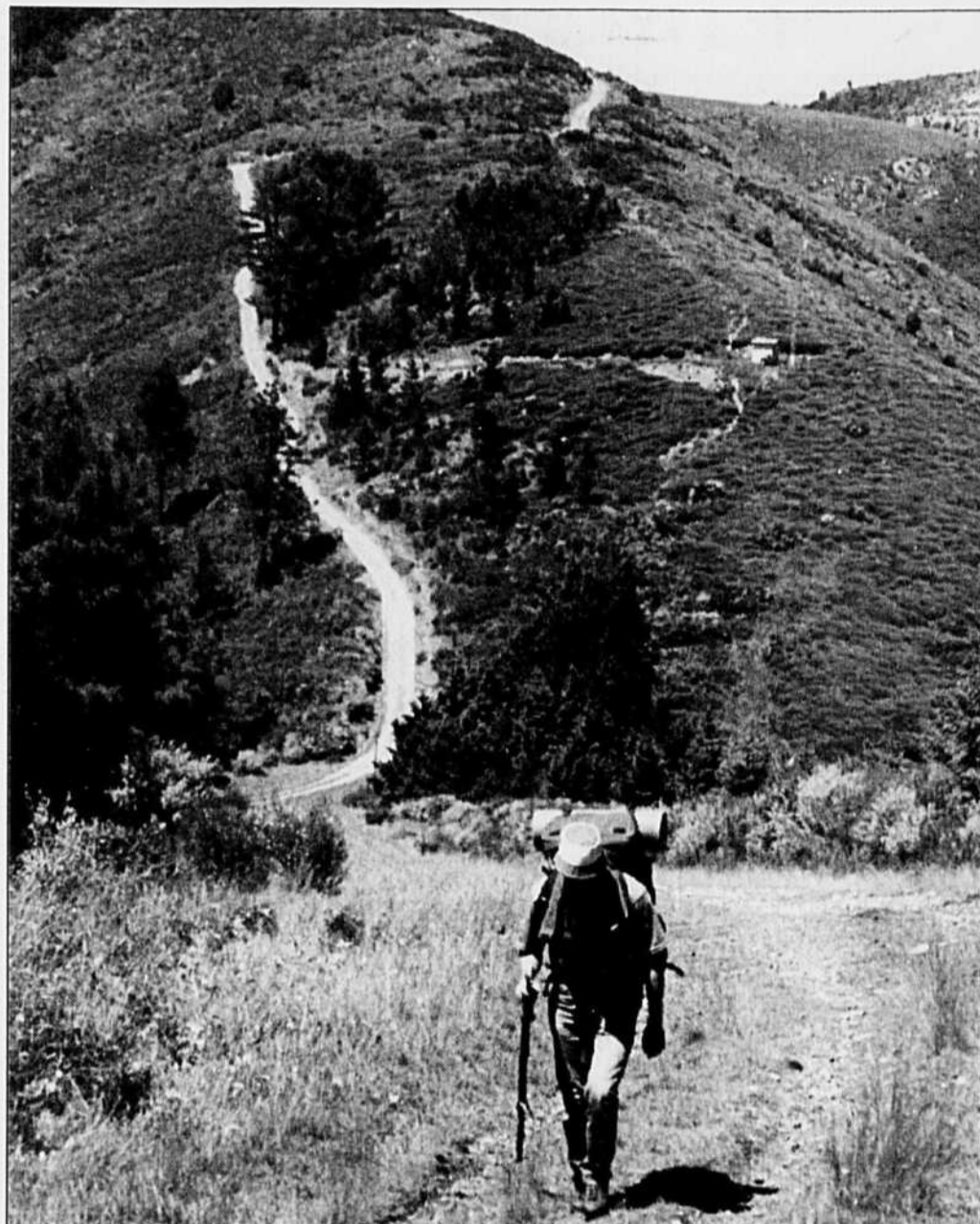
Les Cévennes, aux limites du Midi, région de plateaux et de crêtes qui ne dépassent pas les 1500 m.

Centre d'information sentiers et randonnée, 64, rue de Gergovie, 75014 Paris, France. Tél: 45 45 31 02, Fax: 43 95 68 07.