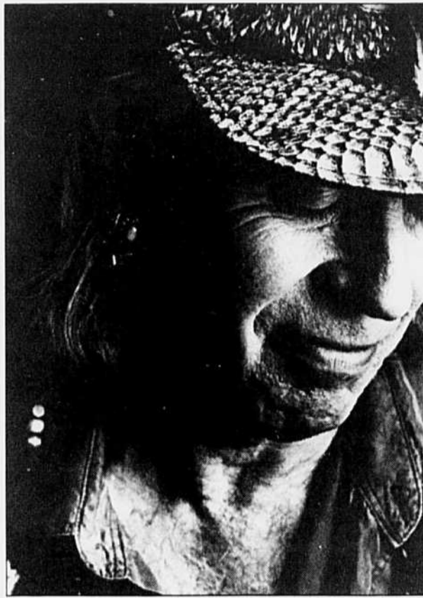
John Mayall: Let there be blues!

Ce n'est pas le grand débordement d'émotion non plus à propos du nouvel album, autour duquel le spectacle cuvée 1993 est principalement bâti: «Nous sommes assez contents. Tout le monde a travaillé très fort là-dessus. Mais encore? Le choix des chansons par exemple? «On avait dressé une liste d'une trentaine de pièces, et on a pris celles dont on pouvait sortir le plus d'énergie.» Et les visites de Buddy Guy sur I Could Cry , pièce de Junior Wells, de Mavis Staples et Mick Taylor sur Wake Up Call , ou d'Albert Collins sur I'm a Sucker for Love? «Bien, la compagnie de disques m'a dit que je pouvais inviter des gens pour cet album, alors j'ai fait quelques appels, rejoint des vieux amis. Je suis content qu'on ait pu tous les avoir sur le disque.» Des affinités particulières — au plan blues