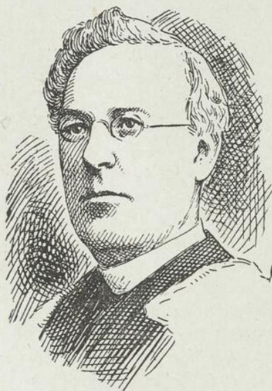
L'abbé H.-R. CASGRAIN