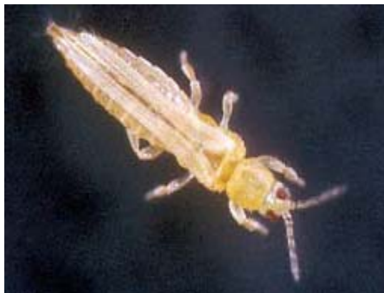
Thrips des fleurs ( Frankliniella tritici ).

Les thrips sont des insectes de très petite taille (1 à 1,5 mm de long) qui peuvent prendre des teintes différentes. En cas de doute, n'hésitez pas à envoyer des spécimens au Laboratoire de diagnostic en phytoprotection du MAPAQ.