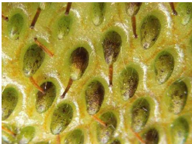
Dégâts de thrips sous les akènes.