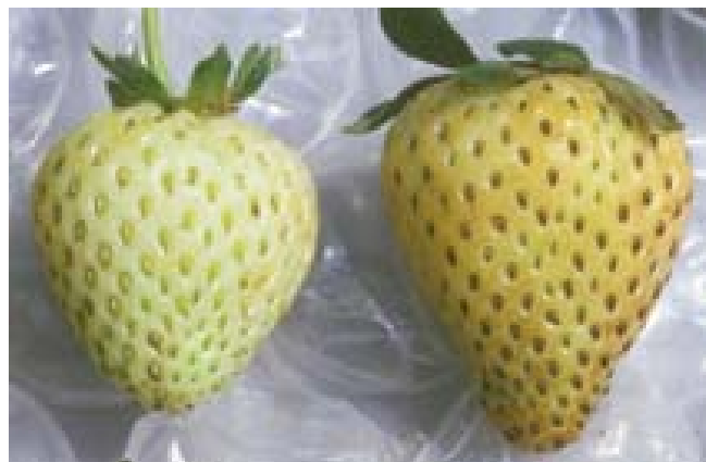
Bronzage associé aux stress climatiques.