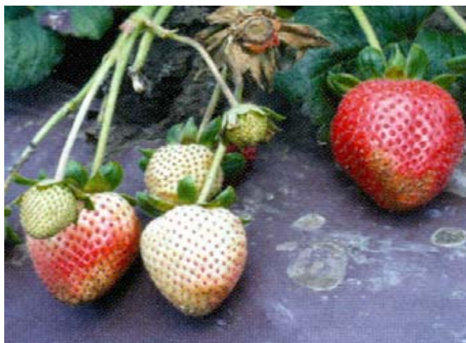
Bronzage associé à une phytotoxicité ou au frottement.