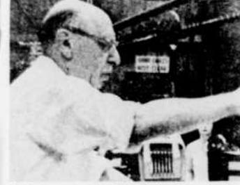
Trois oeuvres de Stravinsky seront au programme de "Festivals", lundi à 8 heures.