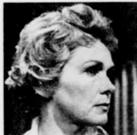
Elisabeth Schwarzkopf, au "Concert" de samedi 8 heures.