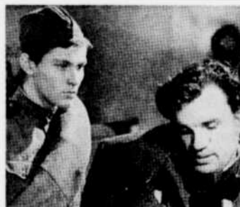
"La Ballade du soldat" sera le long métrage à l'affiche, jeudi à 1 heure de l'après-midi.