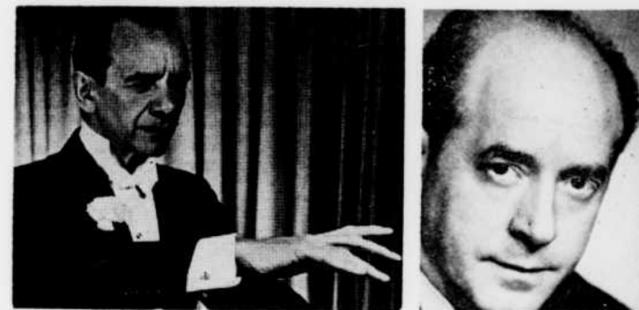
Aux "Chefs-d'oeuvre de la musique", à 3 heures, sir Malcolm Sargent dirigera le Concerto de sir Arthur Bliss, et Eugène Ormandy, la Symphonie no 3 de Camille Saint-Saëns.

10.00—Trente minutes d'informations Nouvelles, commentaires et nouvelles du sport. 10.30—Est-ce ainsi que les hommes vivent? 11.00—Les Mensonges d'Ulysse 11.15—Démons et merveilles CBAF—Détente 11.30—CBAF—Météo et fin des émissions 12.00—Radiojournal CBJ—Fin des émissions 12.02—Nocturne 1.00—Radiojournal 1.02—Musique variée