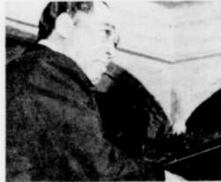
Duke Ellington, à "Jazz d'aujourd'hui", mardi à 10 h. 15.