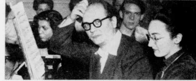
Yvonne Loriod et Olivier Messiaen interpréteront des extraits des "Préludes" et des "Visions de l'Amen" de Messiaen, "En blanc et noir", vendredi à 7 h. 30.