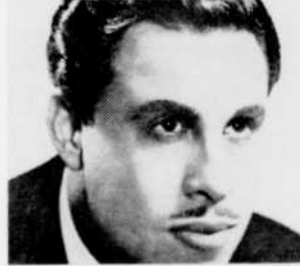
George London, à "Matinée symphonique", vendredi à 1 h. 10.