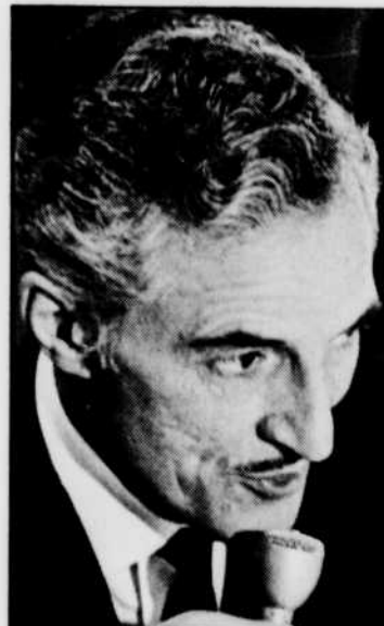
René LECAVALIER décrira la partie de hockey, à 20 h 00.