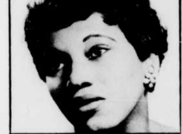
Un récital de Leontyne PRICE, à «Carrefour des arts», MERCREDI à 22 h 30.