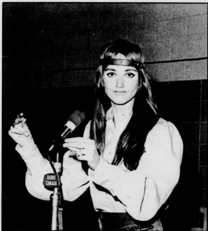
Ici Radio-Canada Horaire des chaînes françaises de radio et de télévision de Radio-Canada Semaine du 7 au 13 décembre 1968