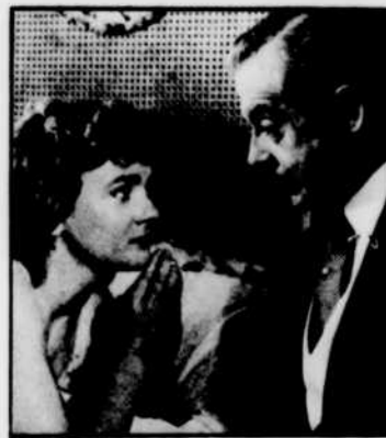
Danièle DELORME et Fernand GRAVEY dans une scène de «Mitsou», à 23 h 30.