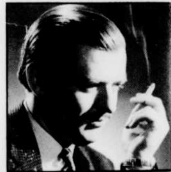
Clermont PÉPIN et les compositeurs qu'il a connus, DIMANCHE à 9 h 05.