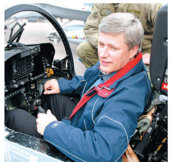
Le premier ministre, Stephen Harper, photographié à l'intérieur d'un CF-18, en 2008.