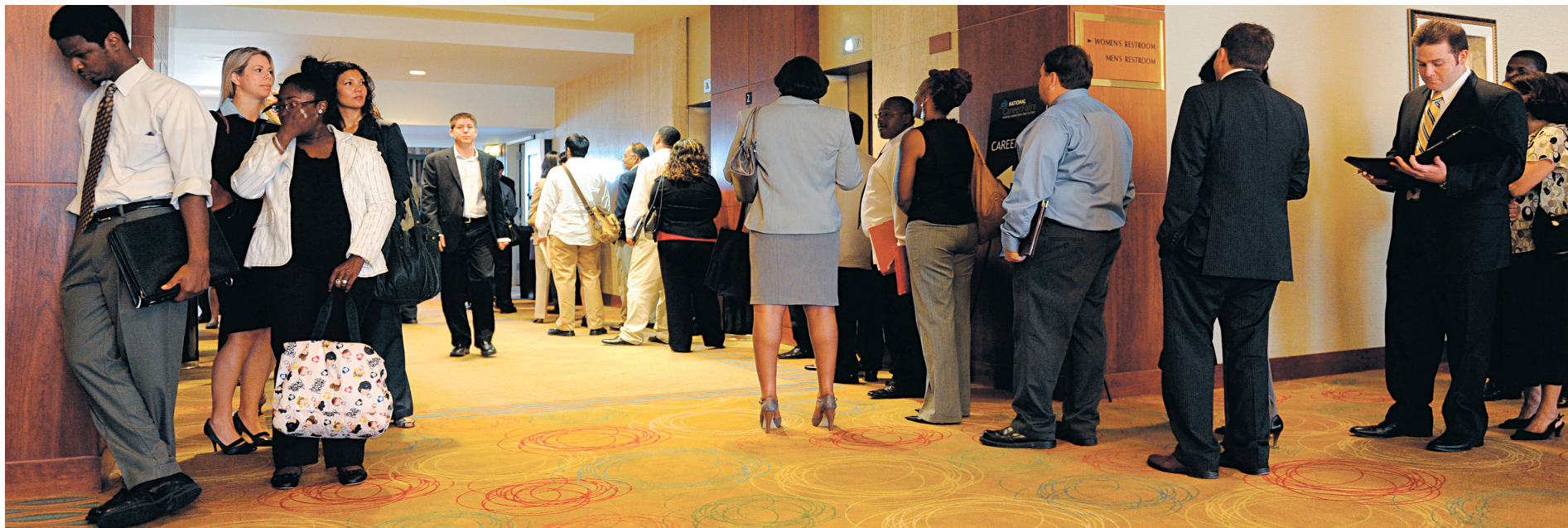
Des chercheurs d'emploi font la file lors d'un salon carrière et profession.