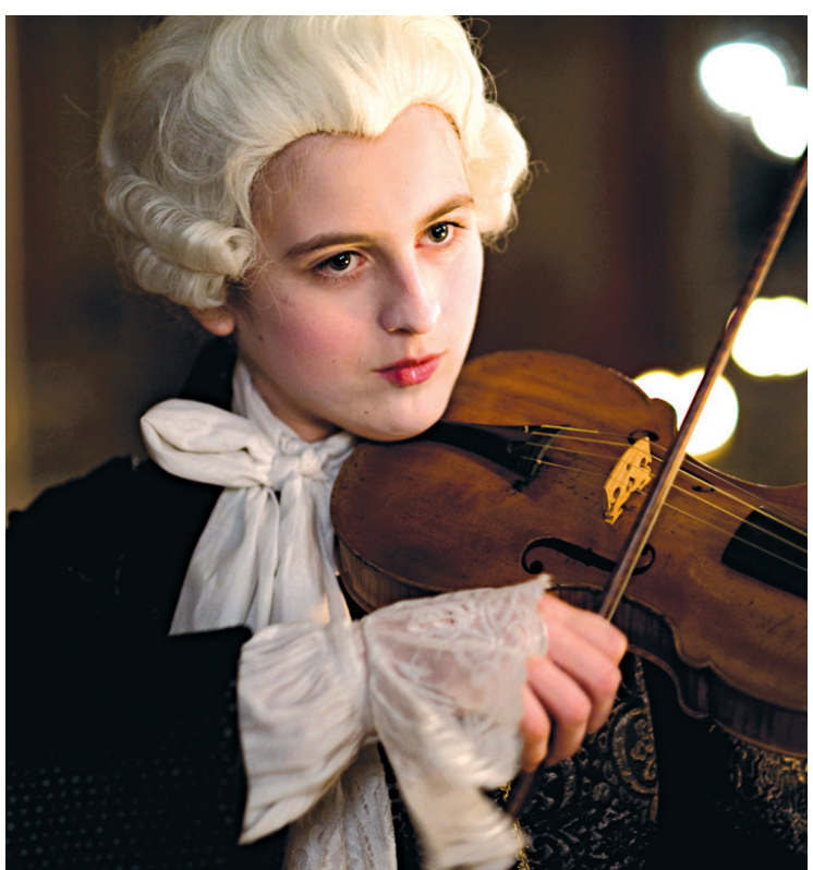
Le film de René Féret retrace l'enfance et l'adolescence de Mozart à travers sa sœur aînée, Maria Anna, dite Nannerl.