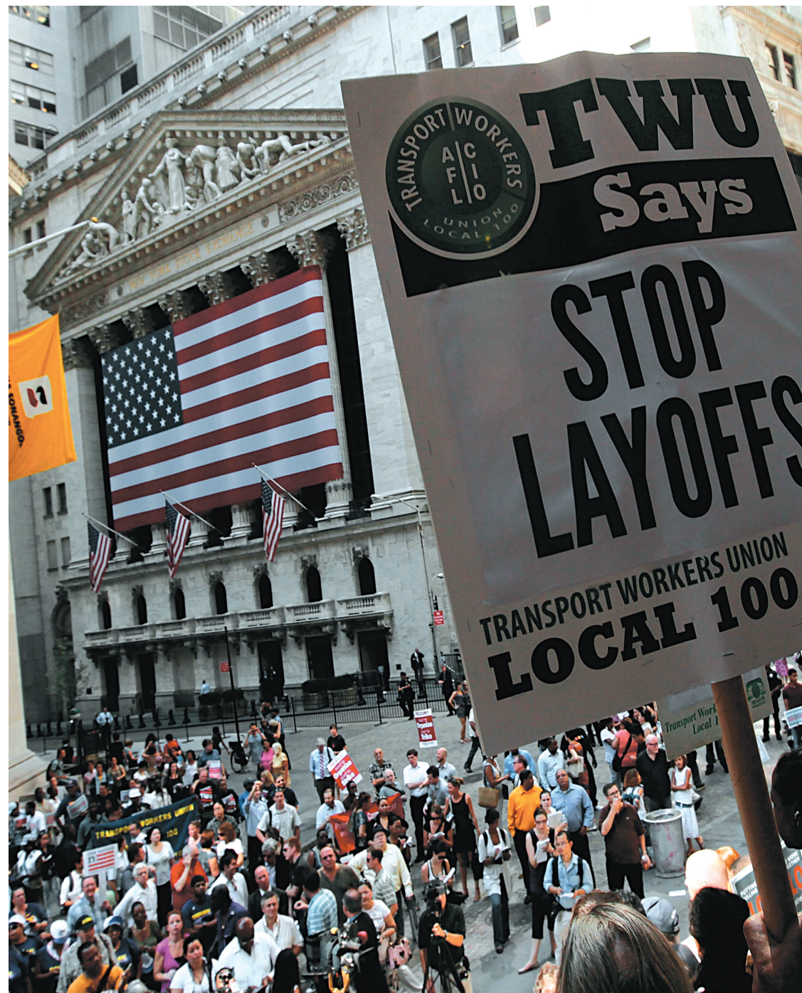
Des sans-emploi ont marché dans le centre de Manhattan, hier, afin de réclamer des mesures favorisant la création d'emplois.