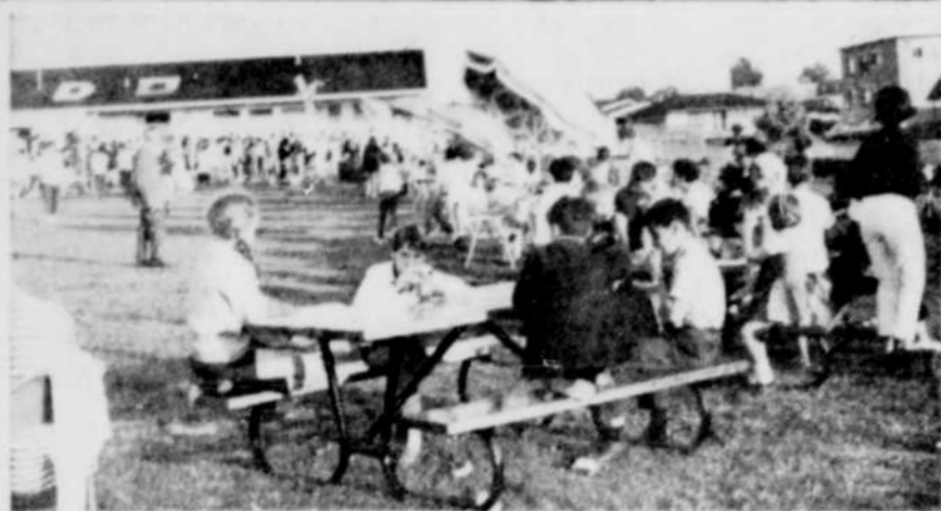
BAL DU CHIEN CHAUD — Une initiative du comité des Loisirs de Drummondville-Ouest, le bal annuel du Chien Chaud au profit des loisirs au parc Frigon, a remporté encore cette année un franc succès. Sur cette photo nous apercevons une petite partie de la foule qui a afflué au parc, pour y déguster des Chiens chauds et participer aux différentes activités de la soirée.