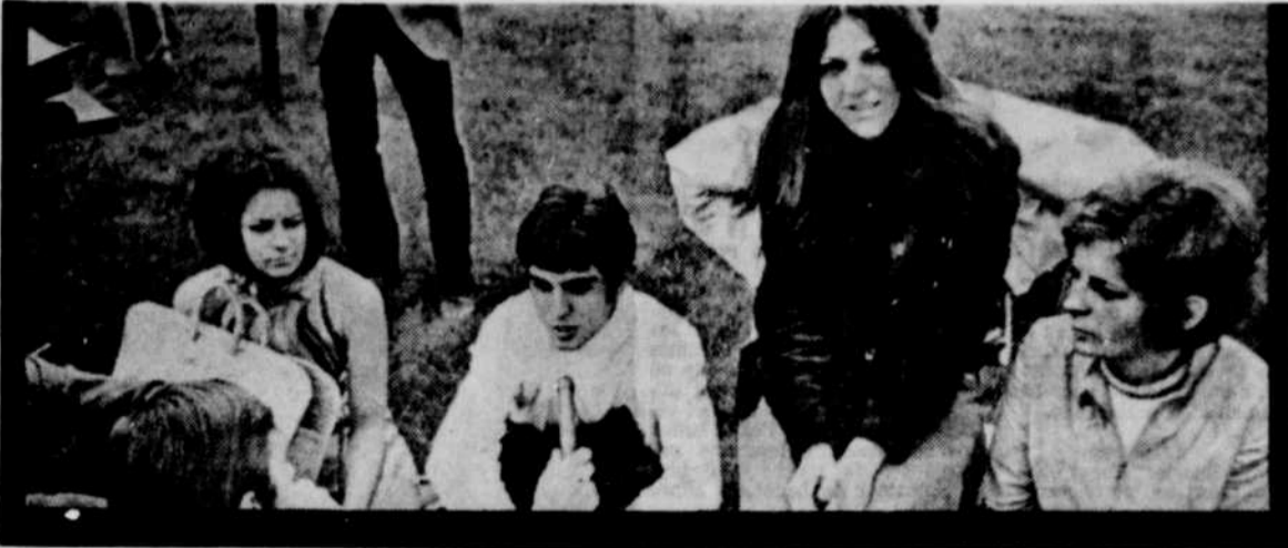
Les adolescents d'aujourd'hui remettent en question les principes de vie qui leur furent inculqués durant l'enfance "Apprendre, c'est contester..." disait Sartre récemment.

"Etre chrétiens dans l'Eglise-Mère équivaut dans l'esprit des gens à être des enfants pas-comme-les-autres, des enfants choyés, des enfants favorisés, des enfants à vocation spéciale, des enfants privilégiés par rapport aux autres enfants qui n'ont pas eu la chance d'être baptisés et d'être élevés catholiquement. Cette espèce de mentalité de petite ville fait horreur dans un monde séculier. Les jeunes le manifestent assez clairement" (p. 146).