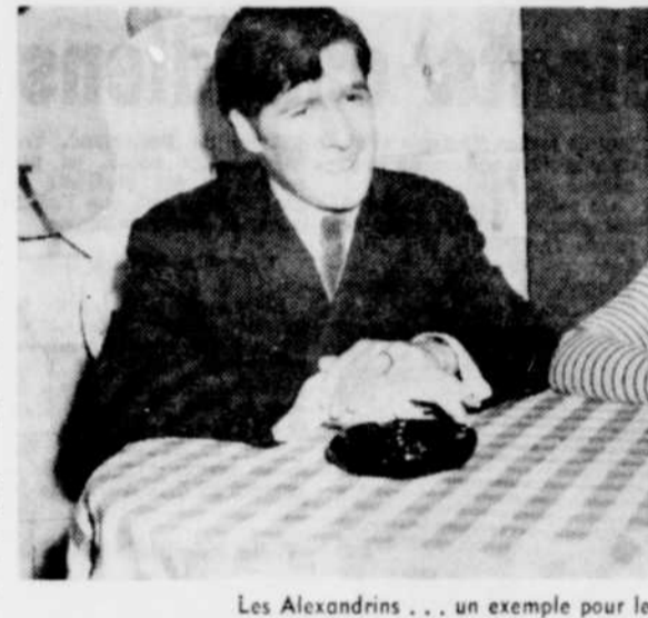
Les Alexandrins... un exemple pour les jeunes.

leurs apparitions à des émissions de variété télévisées, genre LES CAILLOUX. Ils se sont également fait connaître à la région par un engagement d'être à La Marjolaine, il y a de cela deux ans. Les jeunes ne restent pas indifférents à la belle musique et à la belle chanson, surtout quand cette dernière exprime des vérités ou des aspirations chères à cette jeunesse. Même si on aime le bruit et les rythmes scabreux, le romantisme n'est pas mort. L'authenticité est reconnue facilement et on sait y faire une place de choix. Les Alexandrins sont mariés. Cela n'est sans doute pas étranger à leur popularité dans une époque où on valorise le bonheur et l'harmonie du couple. Ils personnifient un autre idéal de la jeunesse: celui de vivre heureux et simplement. Leur popularité ne cesse de grandir. Les jeunes du Québec se laissent subjugués par la sympathie qu'inspirent les jeunes chanteurs. Leur étoile continuera sûrement de briller au firmament de la belle musique. Quelques-unes de leurs chansons: John Kennedy, Amour d'été, Le marché aux fleurs, Chany, Chante cransonnier. Ton cœur n'est pas un violon et plusieurs autres qui se laissent découvrir à chaque parole et à chaque note.