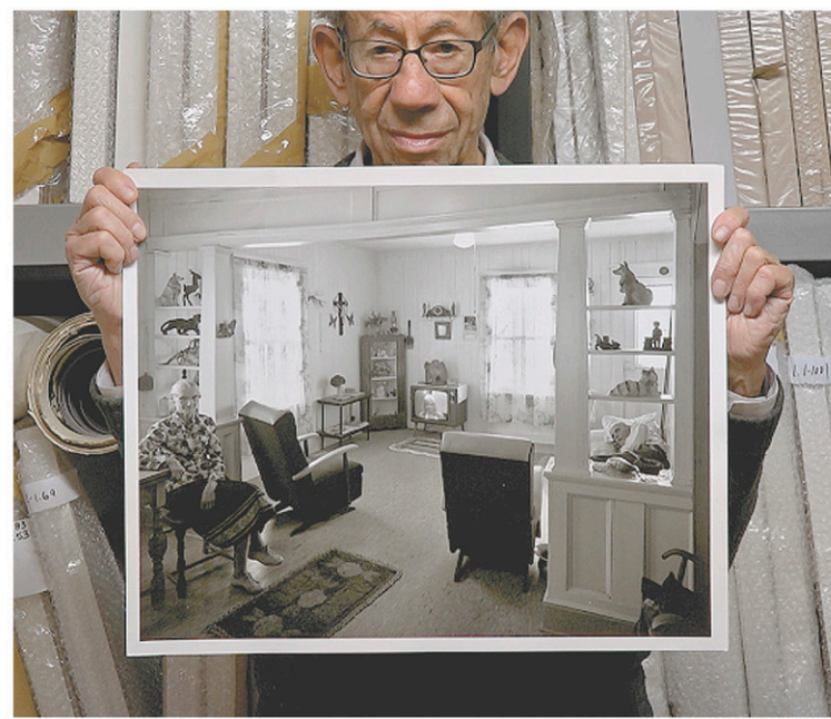
CATHERINE MARTIN / LES FILMS DU 3 MARS

Dans Certains de mes amis , on retrouve notamment Gabor Szilasi, à qui la cinéaste a déjà consacré le film L'esprit des lieux .