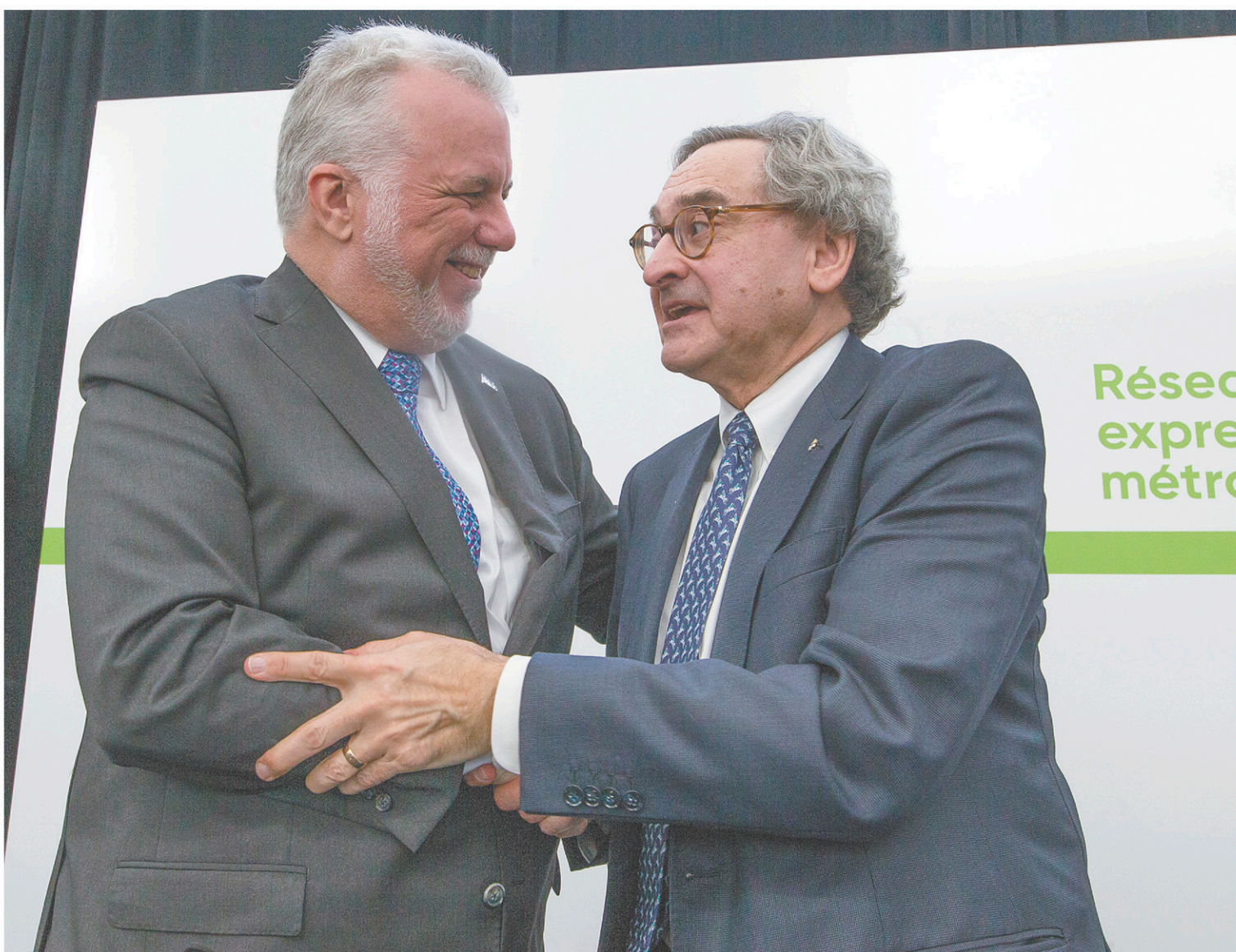
Le premier ministre Philippe Couillard et le président et chef de la direction de la Caisse de dépôt, Michael Sabia, jeudi. La nouvelle mouture du REM coûtera 6,3 milliards de dollars, soit 300 millions de plus que prévu.