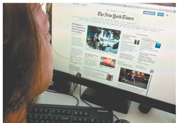
En trois ans seulement, le New York Times a triplé le nombre de ses abonnés aux seuls contenus en ligne.