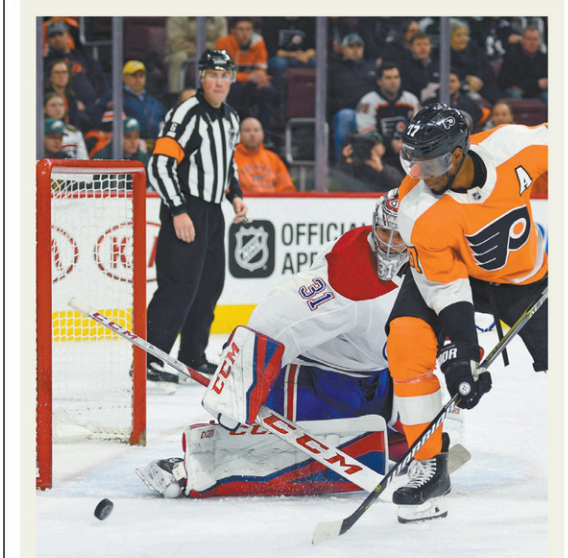
DERIK HAMILTON ASSOCIATED PRESS