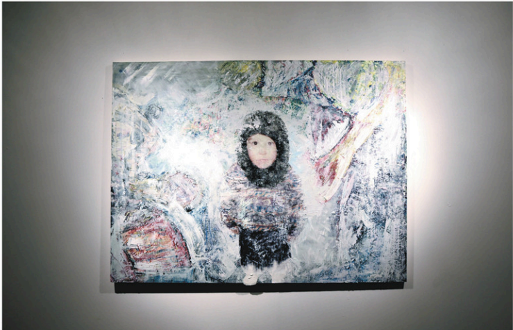
Charlo bongo toujours vivant, de Charles Robichaud

CAHIER B • LE DEVOIR • LE VENDREDI 9 FÉVRIER 2018