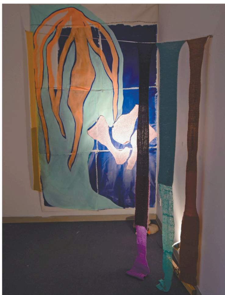
D'un espace à un autre, d'Éloïse Foulon

industriels, une œuvre in situ pensée en fonction de la salle qui lui a été réservée.