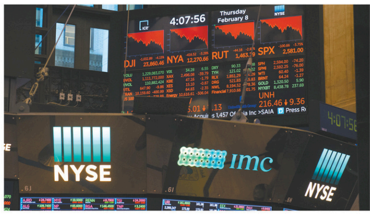
La déroute de Wall Street a été déclenchée la semaine dernière par une montée rapide du taux d'emprunt à dix ans des États-Unis.