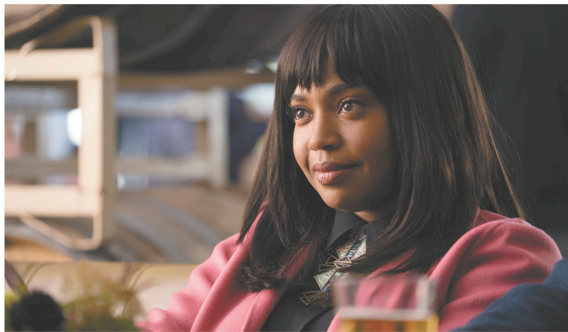
Selon la comédienne Jerrika Hinton, qui joue Ashley, « on se demande si Here and Now est une série dramatique ou une comédie noire », vu l'habileté de l'auteur Alan Ball.

Le surdoué de la télé Alan Ball propose ainsi une autre histoire de famille dysfonctionnelle pour finalement composer un grand portrait de groupe de sa société. Six Feet Under exposait un clan des pompes funèbres vivant de la mort dans une Amé-