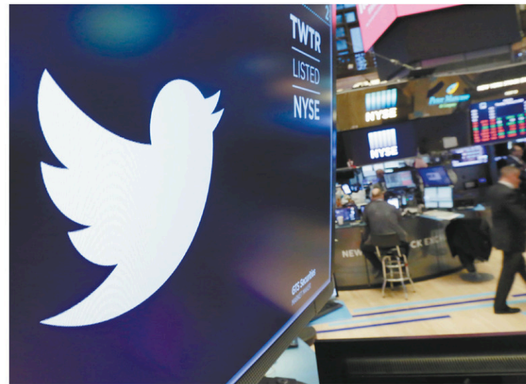
Les revenus de la compagnie se sont engraisés de 2% à 732 millions $US.

« Avec ces problèmes, ils jouent à Whack-A-Mole [NDR :