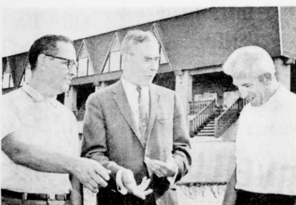
L'AMATEUR DE GOLF aura de quoi se régaler lors du 3e Festival de golf Molson, alors que les professionnels du Québec se disputeront une bourse de $3.500 sur le parcours du pittoresque club de golf de Drummondville. Discutant des