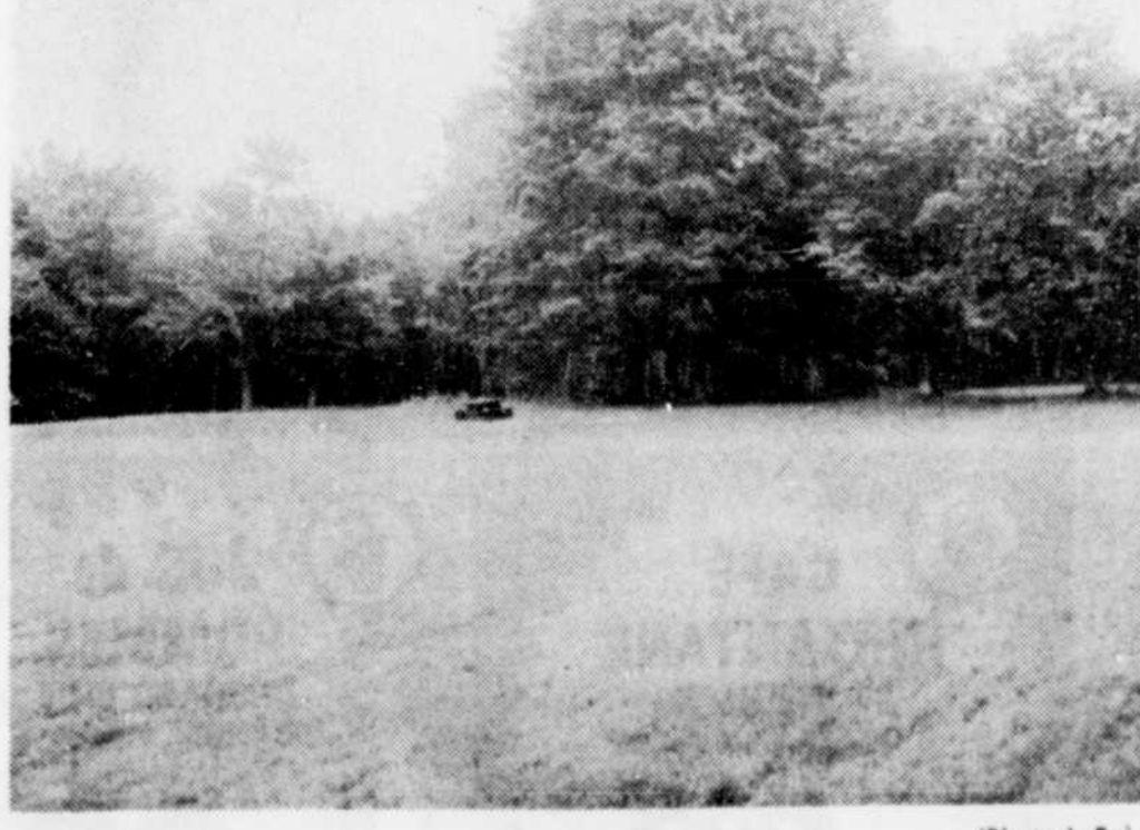
LA CHALEUR VOUS ACCABLE cette semaine? Vous ne savez trop quoi faire entre deux voyages? Allez faire un pique-nique sur la Terre des Jeunes. Prenez-en notre parole: le site y est enchanteur et d'une propreté peu commune. Bien souvent, on fera des milles et des milles à la recherche d'un endroit