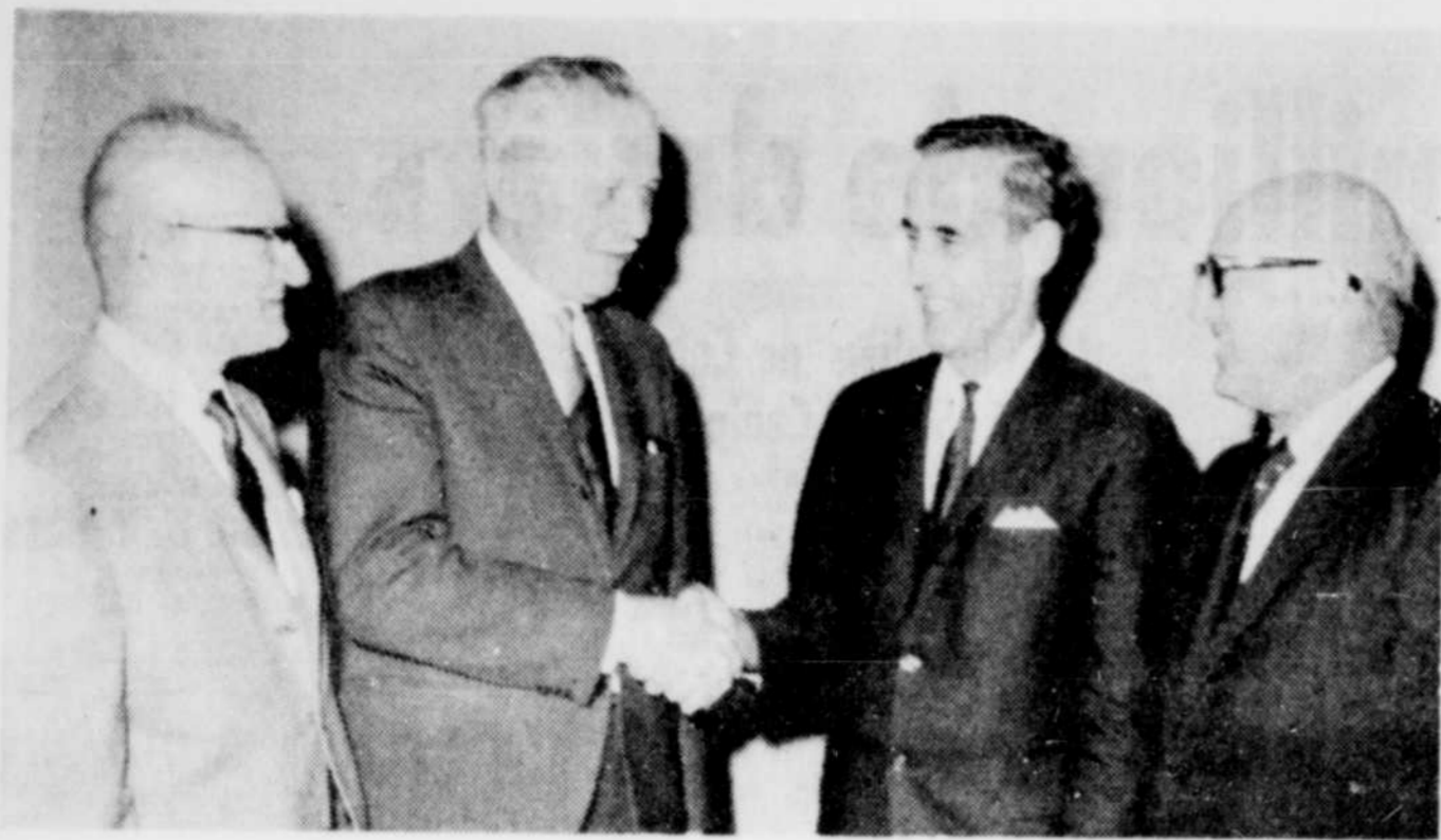
LORS DE LA SESSION ANNUELLE du bureau des délégués de la Commission scolaire régionale St-François, on a procédé à l'élection du président des délégués ainsi que du président de la Régionale. Dans l'ordre, on reconnaît