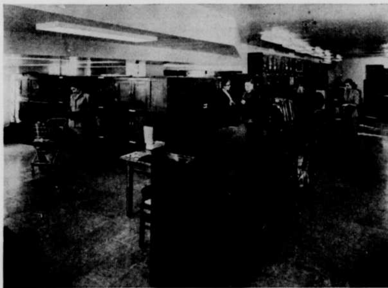
Un coin de la discothèque de Radio-Canada à Montréal, qui sera considérablement agrandie. Elle contient déjà plus de 40,000 disques et transcriptions.

La discothèque du réseau Français à Montréal est l'une des plus complètes au Canada. Elle possède une collection de plus de 40,000 disques et transcriptions de toutes sortes. On y trouve des oeuvres musicales et dramatiques de toutes les époques, des disques de musique d'atmosphère et de bruits divers, folklore de tous les pays etc. Son personnel compétent, sous la direction de Mlle Marie Bourbeau, est prêt à tout, car il faut alimenter les ondes de toutes sortes de musiques. Bach et Beethoven voisinent avec les récents succès de la chansonnette française et américaine. La radio fonctionne sous le signe de la variété et c'est ainsi qu'elle parvient à toucher tous les publics.