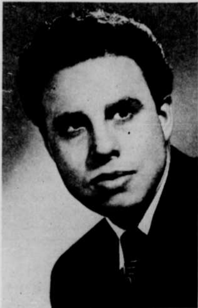
GEORGE LONDON que l'on entendra dans "Les Noces de Figaro", de Mozart.