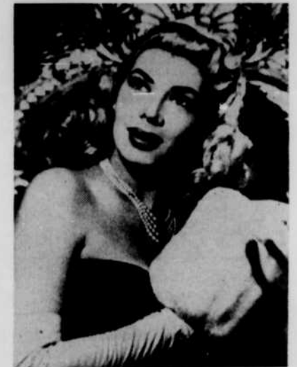
DOLORÈS GRAY, la vedette d'une série de spectacles que CBFT présente sous le titre de "Holiday in Paris".

Le grand public, si l'on en juge par l'expression de son opinion, semble priser beaucoup la formule du programme questionnaire à la télévision. Parmi les diverses émissions de ce genre inscrites à l'horaire hebdomadaire de CBFT, on en trouve une qui plaît tout particulièrement par son esprit "carabin": Les Escholiers de la Grande Ecole .