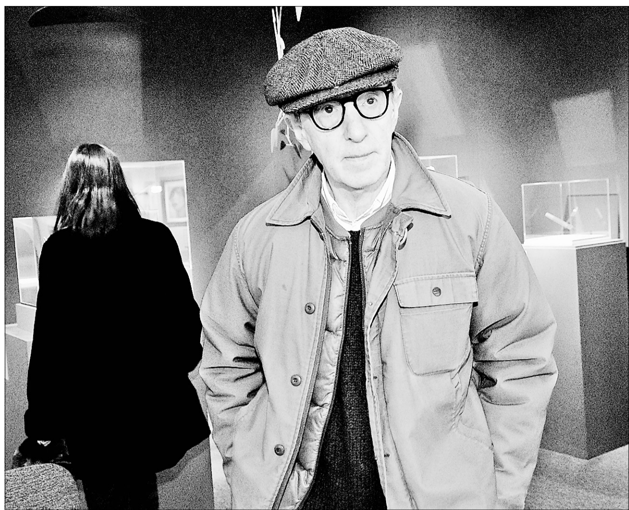
On ne verra pas de sitôt Woody Allen porter un t-shirt d'American Apparel.

jeunes mannequins d'un jour, recrutés directement dans la rue et dont les poses lascives sur les affiches sont à la limite de la porno et parfois même de la pédophilie, tant les filles sont jeunes.