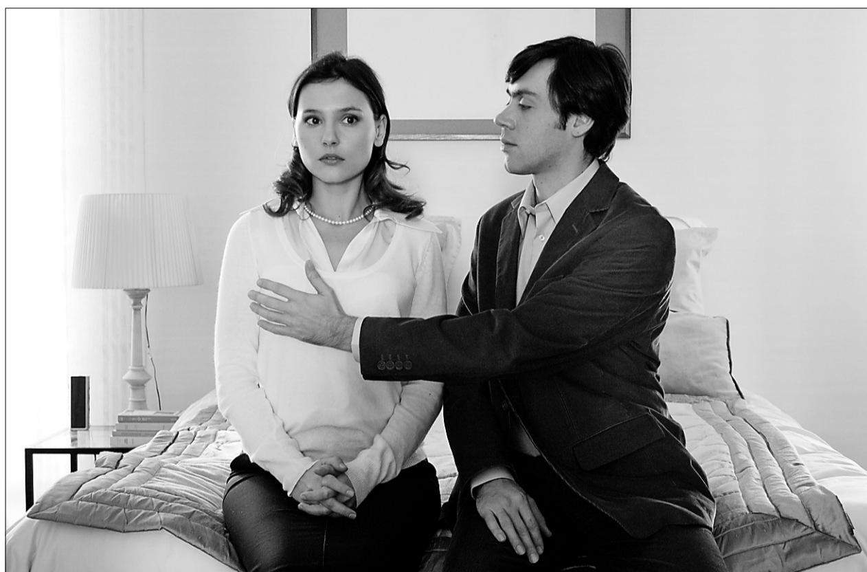
La perte d'écrans d' Un baiser s'il vous plaît , un film présenté dans le cadre des festivités du 400 e de Québec, est vivement regrettée par Unifrance, l'organisme chargé de la promotion du cinéma français dans le monde.

C'est tellement gros, tellement absurde que le problème a même été soulevé à l'Assemblée nationale. Depuis que Dussault a alerté les médias, je cherche à voir clair dans ce dossier. Rien ne relève de l'évidence. Étonnamment, la situation est beaucoup plus complexe qu'on ne pourrait le croire au premier abord. Le litige est d'autant plus difficile à comprendre dans sa globalité que les différents intervenants du milieu, à qui j'ai parlé au cours des derniers jours, l'interprètent forcément à l'aune de leurs propres intérêts. D'ailleurs, le problème semble tellement délicat que la