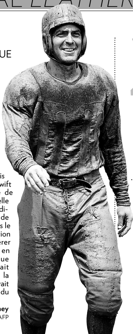
George Clooney

Quand il a ressorti le scénario de Leatherheads de ses tiroirs 10 ans après que le projet eut été abandonné par Steven Soderbergh, George Clooney s'est inspiré d'une histoire qui s'est déroulée pendant la campagne présidentielle de 2004 pour y ajouter une nouvelle dimension. « Je trouvais intéressant de donner au personnage qu'incarne John Krasinski un passé héroïque qui pouvait être remis en question. Quand l'association Swift Boat Veterans for Truth a décidé de réaliser une publicité dans laquelle elle s'en prenait au passé militaire du candidat démocrate John Kerry, j'ai tout de suite eu l'idée de transposer cela dans le scénario. Cela n'a aucune connotation politique. Il s'agissait plutôt d'insérer un élément supplémentaire, riche en potentiel comique. » Rappelons que l'organisation en question estimait John Kerry « non présidentiable » à la suite des critiques que ce dernier avait formulées à son retour de la guerre du Vietnam.