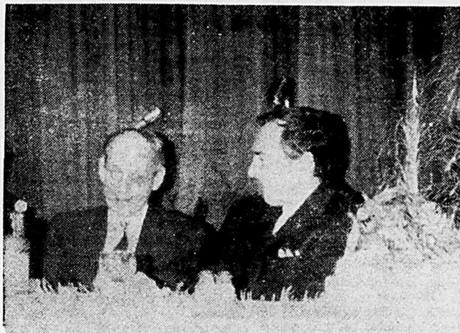
L'ancien ministre René Lévesque a causé avec M. Jacques Mondor, président fondateur des "Enseignants du Lanaudière" l'autre mardi lors du premier dîner de l'année de ce groupement. Des malins ont cru qu'à ce moment les deux interlocuteurs causaient de séparatisme ou... des mini-plaques de voitures. Les journalistes n'ont tout de même pas voulu percer le secret de cette conversation.