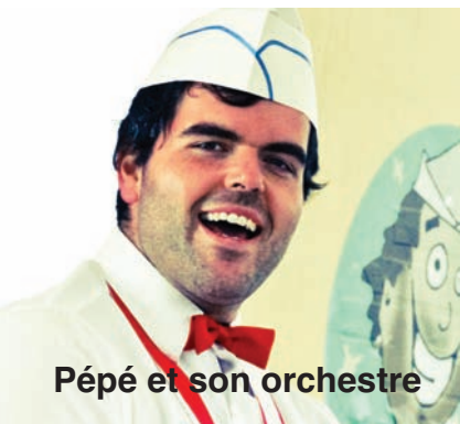
Pépé et son orchestre