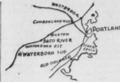
Carte de Boston au Maine, indiquant la position de Waterboro, où trois hommes, dont un Canadien-français, ont perdu la vie dans un accident de chemin de fer.

Les personnes qui étaient sur la plateforme de la gare ont aperçu tout-à-coup la lumière des locomotives perçant le brouillard, mais il était trop tard et