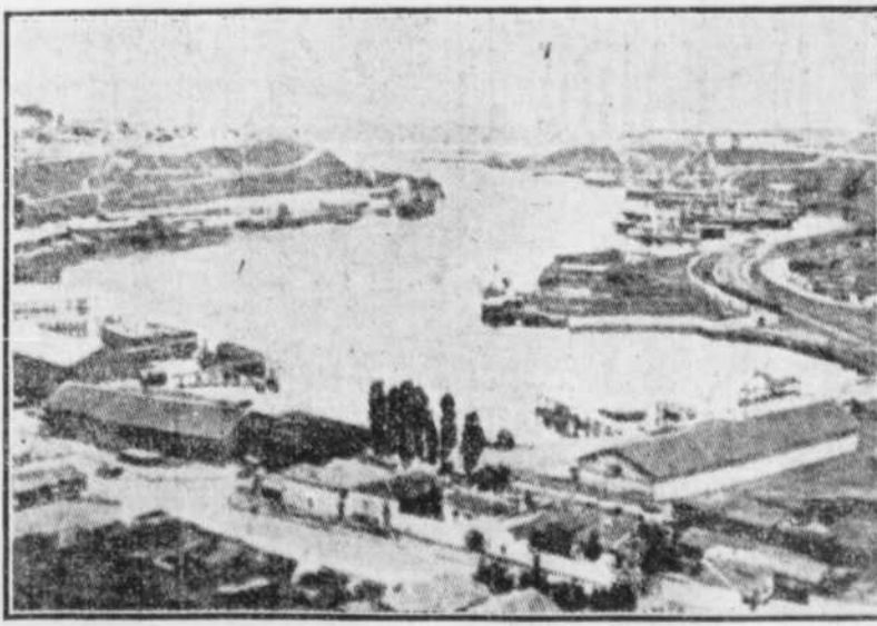
LE PORT DE SEBASTOPOL, QUE LE MARINS MUTINS TIENNENT EN LEUR POUVOIR.

heures tous se rendaient, drapeaux en tête et en bon ordre, aux quartiers du régiment de Brest. Les officiers de ce corps menacèrent d'ouvrir le feu sur les manifestants, mais finalement le général Neptueff, un colonel et cinq autres officiers se rendirent et furent conduits à la prison de la marine.