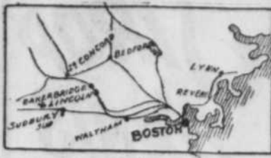
Carte de la voie de Boston au Maine, indiquant la position de la petite gare de Baker's Bridge, où a eu lieu le terrible tamponnement qui coûta la vie à plus de 20 personnes.

Le train rapide de Boston à Montréal frappe un convoi local chargé de voyageurs à la station de "Baker's Bridge," occasionnant la mort de 15 personnes et en blessant gravement une trentaine. Personne de Montréal n'a été blessé. L'express et le local.