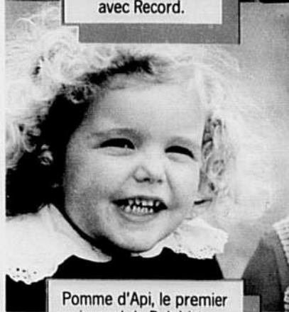
Pomme d'Api, le premier journal de Delphine.