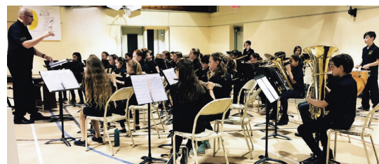
Photo : Harmonie cadette Saint-Léon

Mais comment parvenir à une telle unité sans le support et l'expertise des chefs d'orchestre que sont les enseignants responsables de ces harmonies? Sans leur rigueur, leur engagement et leur patience, nous pouvons imaginer que le résultat pourrait s'avérer moins harmonieux!