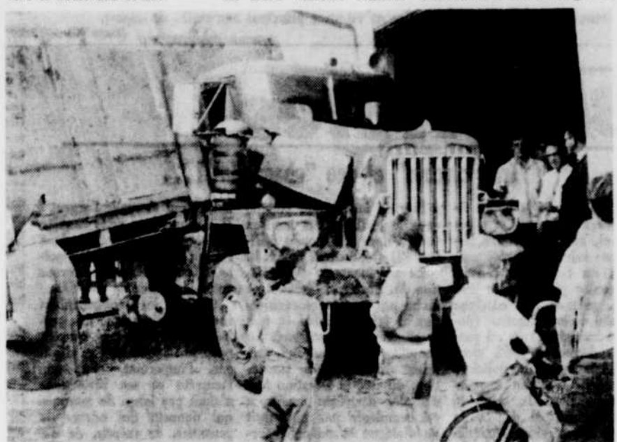
LE LOURD CAMION s'est arrêté sur un hangar après avoir heurté deux automobiles. Le camion aurait fait tout cela sans conducteur.

La première voiture serait une perte totale tandis que le lourd véhicule aurait subi des pertes pour environ $1,000 et le véhicule de M. Plourde aurait des réparations pour quelques centaines de dollars. L'édifice de la ville serait endommagé pour $500.