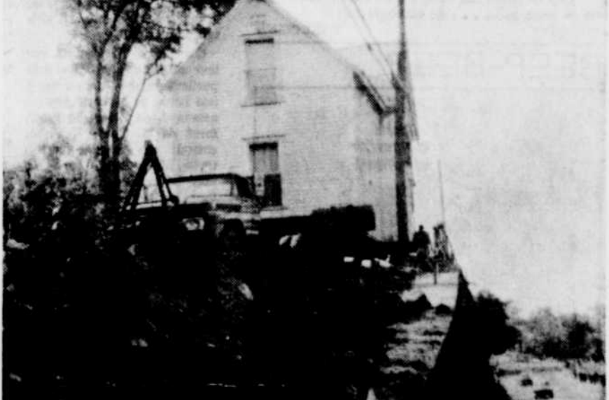
CETTE MAISON DE COATICOOK fait partie du groupe de maisons qui sont appelées à disparaître pour faire place à la nouvelle rue Child, à Coaticook. Serait-ce que le propriétaire craint un nouveau glissement? Ou bien tout simplement qu'il est "tanné" d'attendre que les travaux ne débutent. Nul ne le sait. C'est néanmoins un pas vers l'avant, puisque il n'en restera plus que six à déménager ou à déconstruire avant que la nouvelle section de rue ne soit faite.

Le feu avait pris naissance dans un récipient contenant du Varsol, un liquide facilement inflammable, mais les pompiers ont pu maîtriser l'élément destructeur à l'aide d'extincteurs chimiques.