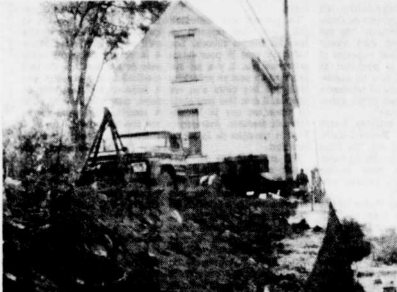
CETTE MAISON DE COATICOOK fait partie du groupe de maisons qui sont appelées à disparaître pour faire place à la nouvelle rue Child, à Coaticook. Serait-ce que le propriétaire craint un nouveau glissement? Ou bien tout simplement qu'il est "tanné" d'attendre que les travaux ne débutent. Nul ne le sait. C'est néanmoins un pas vers l'avant, puisque il n'en restera plus que six à démolir ou à déconstruire avant que la nouvelle section de rue ne soit faite.

LAC-MEGANTIC, (GD) — Aucune décision n'a encore été prise quant à la forme que prendra ce panneau mais il est certain que, si les organismes sollicités réagissent favorablement, on verra l'écusson emblématique de chacun des clubs sociaux qui participent à sa réalisation. Certains visiteurs, on le sait, déplorent le fait que l'on n'indique pas de façon visible ce que l'on peut trouver en fait d'activités sociales à Lac-Mégantic. L'érection du panneau projeté comblerait cette carence.