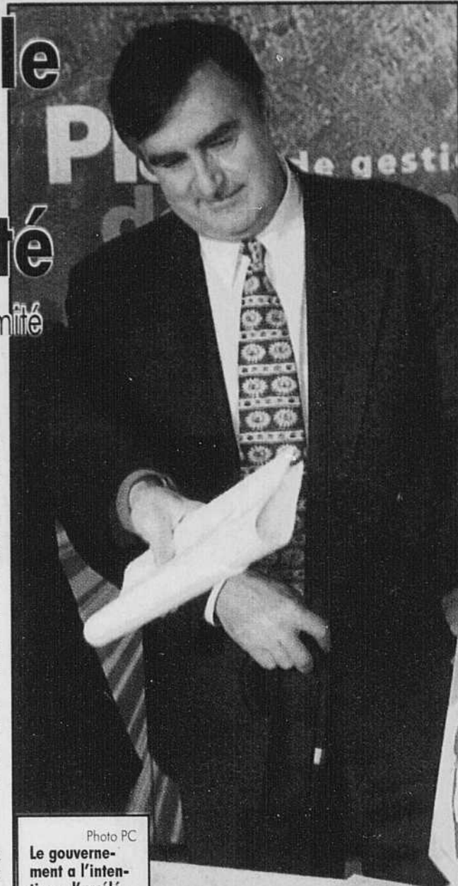
Le gouvernement a l'intention d'accélérer le rythme vers la souveraineté, maintenant que les négociations avec les syndicats du secteur public ont été complétées et que les finances du gouvernement ont été assainies, a affirmé hier Lucien Bouchard.

Le premier ministre Bouchard et lui-même s'opposent à l'abandon de cette portion du programme.