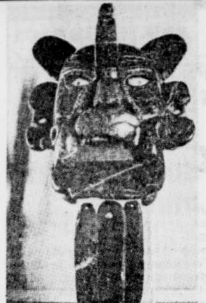
Une des pièces archéologiques volées à Mexico.

Dans les semaines qui avaient suivi le tremblement de terre au Mexique, quelque 140 pièces parmi les plus précieuses des cultures maya, mexica et mixtèque avaient été volées. Toute personne qui aurait des informations peut communiquer avec le consulat général du Mexique à Montréal (514-288-2502).