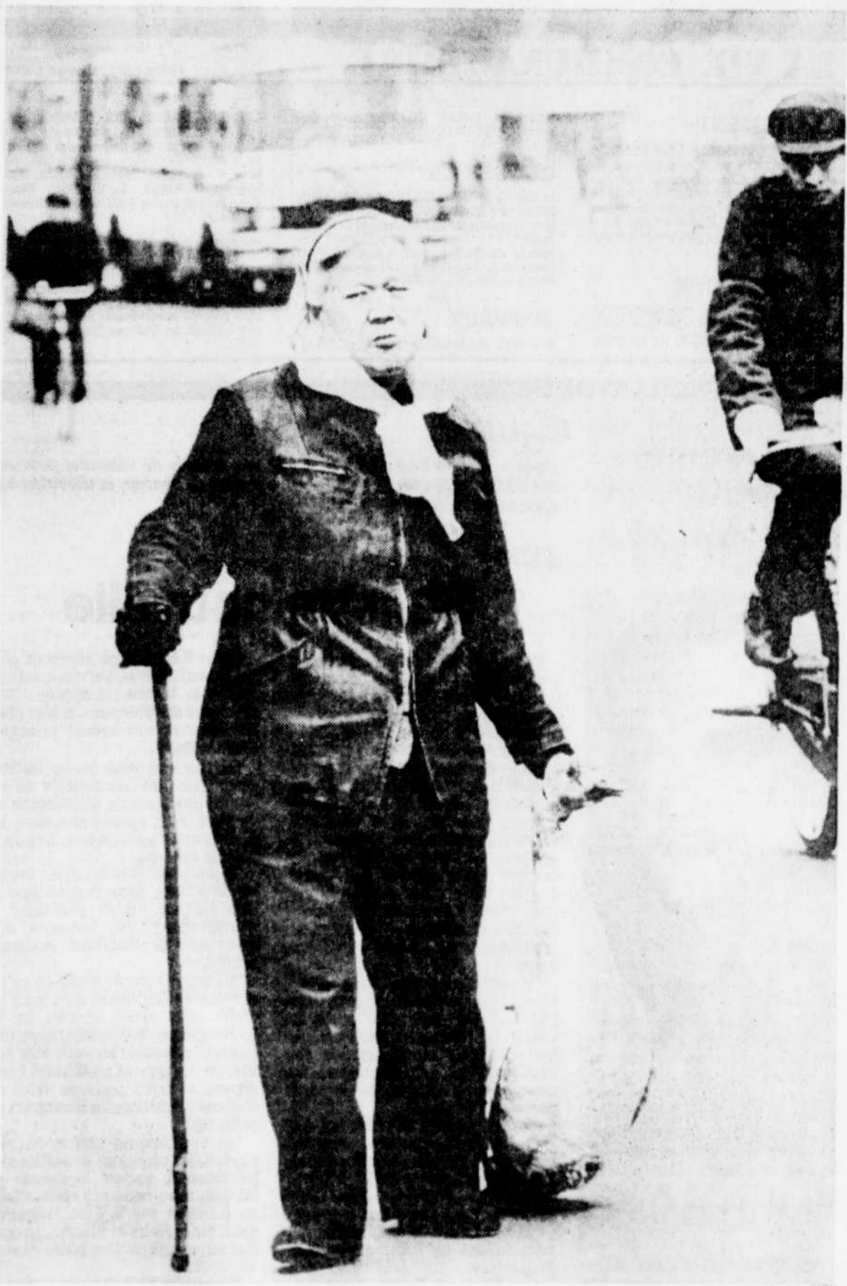
Dans la course à la consommation, les tickets de rationnement ont pratiquement disparu. Ici, une Chinoise ramène du marché "libre" de Pékin une oie bien dodue.

Les pédiatres chinois en viennent même à déplorer que les mères de familles gavent leur progéniture de suceries et les diététiciens lancent un cri d'alarme: les Chinois mangent trop de viande, trop salé et trop gras.