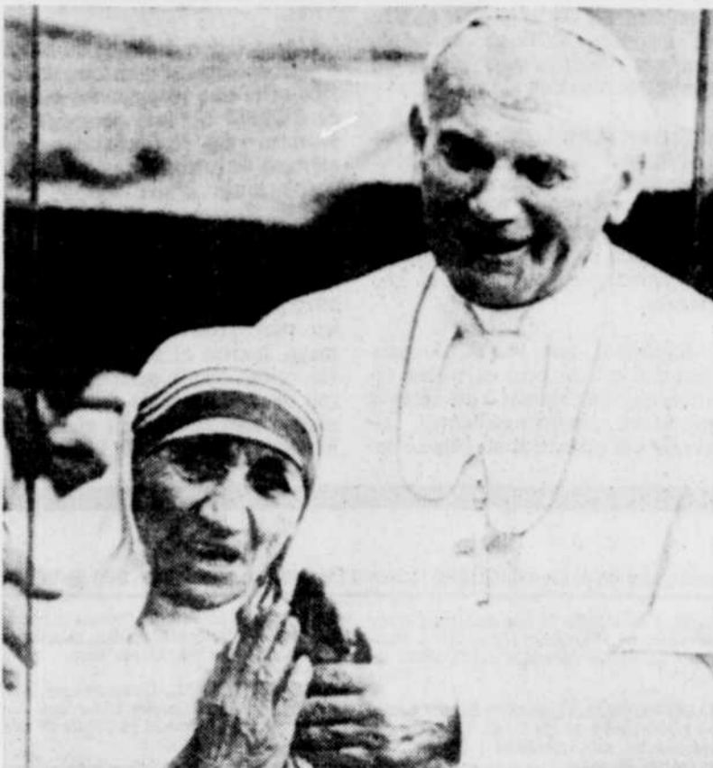
Jean-Paul II n'a pas manqué de rendre visite dimanche, à Calcutta, à Mère Teresa, dont l'engagement à l'égard des déshérités ne fait pas de doute.

À qui cette ambiguïté pourra-t-elle servir?