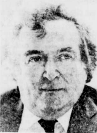
Plutôt que de tenter de construire une anthologie de textes existants, le CEAD a choisi d'en commander. Le volume "Vingt ans" permet ainsi de mesurer d'une autre façon le chemin parcouru par la dramaturgie québécoise. De gauche à droite, et de haut en bas: Marie Laberge, Michel Tremblay, André Ricard et Marcel Dubé.