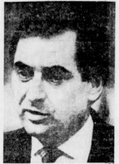
Pour la première fois, hier, le ministre des Transports, M. Don Mazankowski, a fixé une échéance dans le dossier.