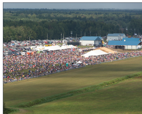
Passion avion a attiré les foules les 29 et 30 août derniers.