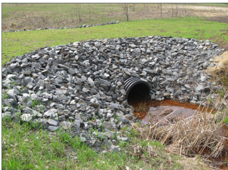
Tous les travaux mineurs ou majeurs effectués dans un cours d'eau, comme l'installation d'un ponceau, nécessitent une autorisation.