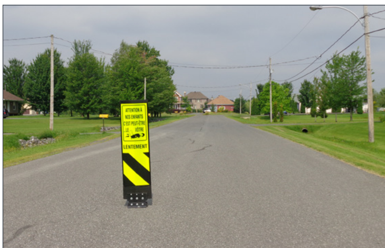
Des mesures d'apaisement de la circulation ont été mises en place à certains endroits.

En ce qui concerne mes implications au sein des comités arts, culture et immigration, développement social ainsi que participation citoyenne et ville intelligente, sachez que les travaux évoluent en gardant en tête les soucis d'accessibilité et d'amélioration continue.