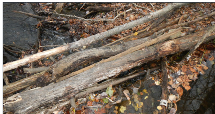
Chaque citoyen a l'obligation d'assurer le libre écoulement d'un cours d'eau situé sur sa propriété.

Pour en savoir plus, rendez-vous au www.ville.drummondville.qc.ca , dans la section Environnement , ou écrivez à environnement@ville.drummondville.qc.ca .