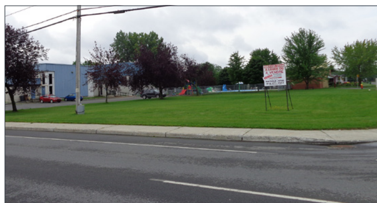
Les enfants qui fréquentent le Centre communautaire Pierre-Lemaire bénéficieront d'un espace additionnel pour s'amuser.

L'animation et la qualité de la vie de quartier ont été consolidées et même améliorées par l'acquisition du terrain adjacent aux infrastructures actuelles par le conseil d'administration du Centre communautaire Pierre-Lemaire (CCPL), avec un soutien important de la Ville. Ce site permettra aux enfants profitant des services du CCPL de bénéficier d'un plus grand espace de verdure pour bouger, et ce, de façon sécuritaire.