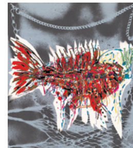
Jean Paul Riopelle, Dans le filet , 1985, lithographie, 90,5 x 71,0 cm © Succession Jean Paul Riopelle / SODRAC (2015)

la même générosité de formes. Une première dans notre région, cette exposition est réalisée en collaboration avec la Galerie Simon Blais de Montréal et mesdames Yseult et Sylvie Riopelle, filles de l'artiste.