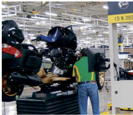
L'entreprise BRP doit suspendre, à la demande du gouvernement du Québec, ses activités de production à Valcourt. (photo d'archives)

BRP affirme avoir appliqué les mesures recommandées par le gouvernement, en plus de mettre en place des mesures d'hygiène et de propreté