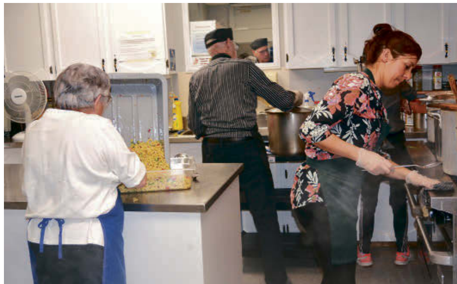
Le milieu communautaire régional, dont le Centre de bénévolat d'Acton Vale, a dû suspendre ou reporter plusieurs activités et services à cause de la crise sanitaire du coronavirus.

Le Centre Ressources-Femmes de la région d'Acton a mis ses activités prévues jusqu'au 27 mars en pause, pour ensuite réviser la situation le 30