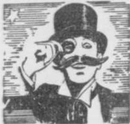
— PAR — L'ACADEMICIEN