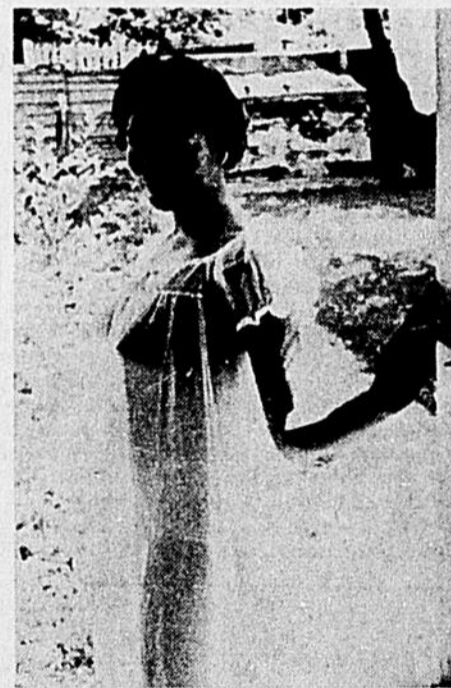
En dépit de toutes les résistances, et à l'insu d'Elsa, le Q.L. a réussi à mettre la main sur cette photographie de la belle ingénue par des voies que, pour être justes, nous ne qualifierons pas d'orthodoxes.

Car, si vous aviez l'expérience de la vie dont il serait déplacé de ma part de tirer gloire, vous sauriez qu'il existe des milliers de jambes d'hommes musclées, poilues, alliant la rugosité jouissante de l'écorce de bouleau et du feuillage de sapin à la douceur subtile de la mousse des bois. . . Si ces comparaisons d'origine forestière me viennent si spontanément à l'esprit, c'est que j'ai connu mes transports les plus ardents auprès d'un bûcheron.