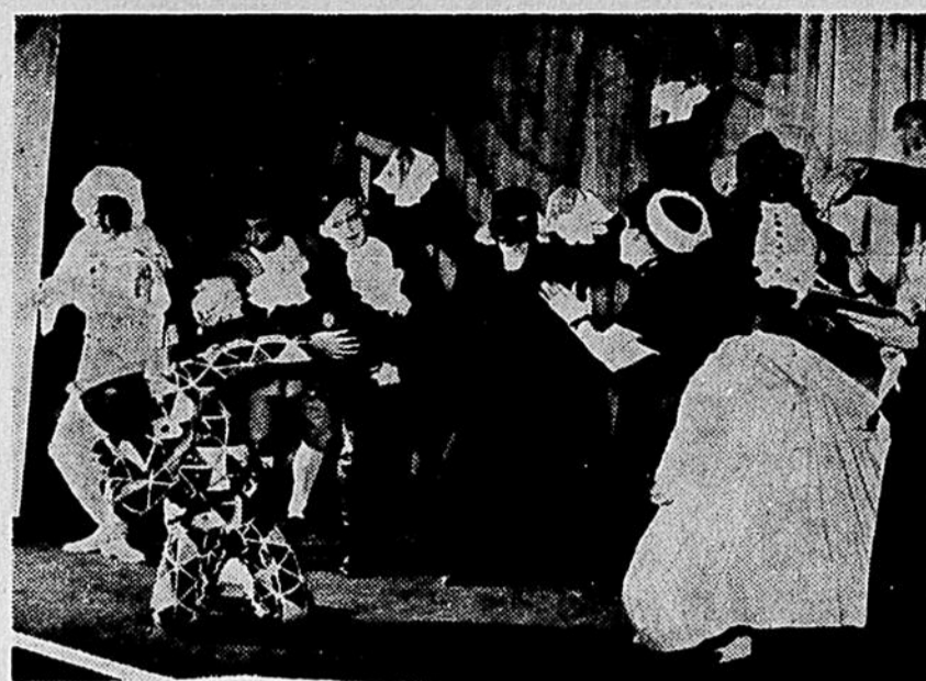
Le "Piccolo Teatro di Milano" dans une scène du "Serviteur de Deux Maîtres" que vous pourrez applaudir du 22 au 27 mars prochain au Her Majesty's.