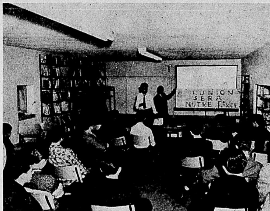
Le responsable de la Fédération de St-Jérôme dirige une discussion avec des jeunes travailleurs sur la nécessité de l'organisation des loisirs.