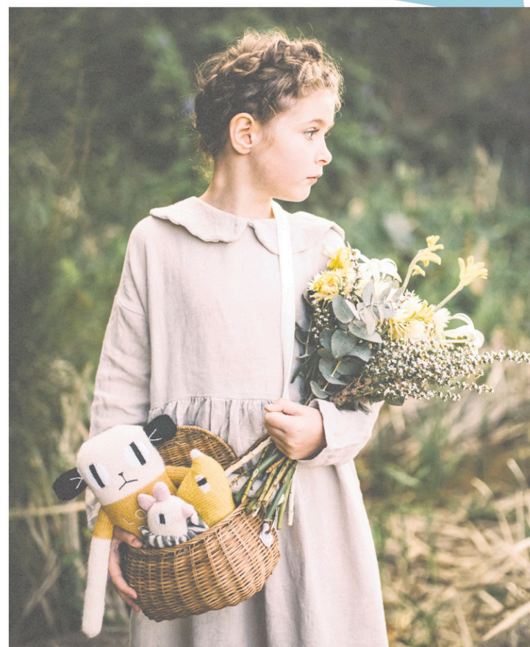
Commerce équitable et accessoires textiles.