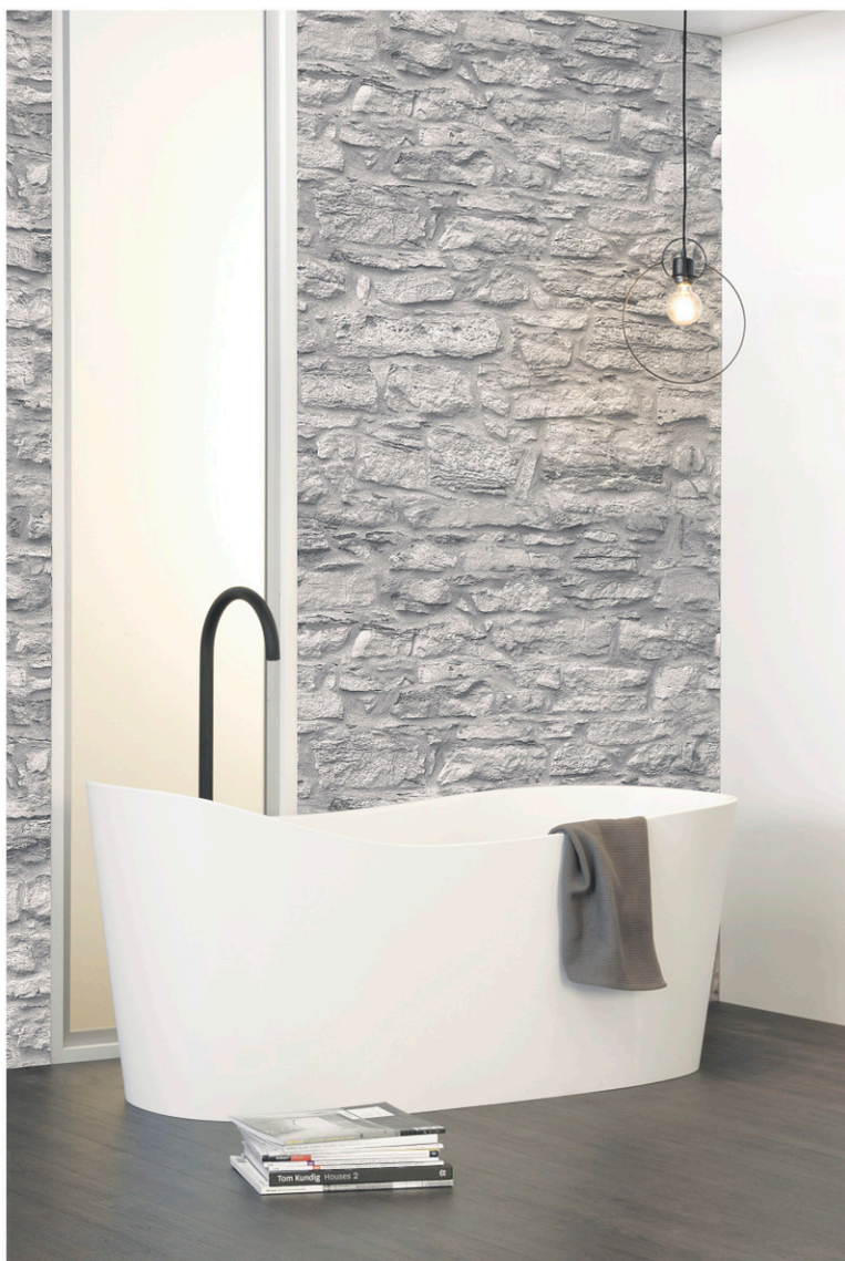
La Wave, un modèle autoportant, fait moins de 58 pouces de longueur.