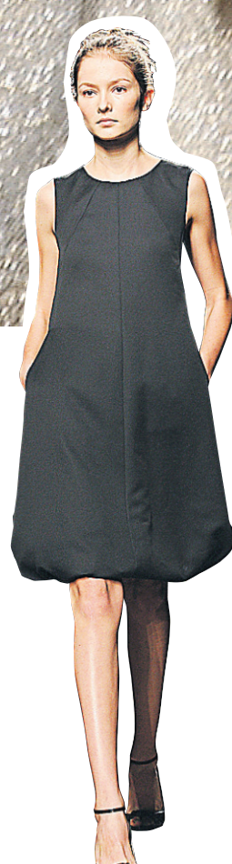
[Bottega Veneta]