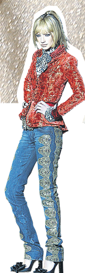
[Just Cavalli]