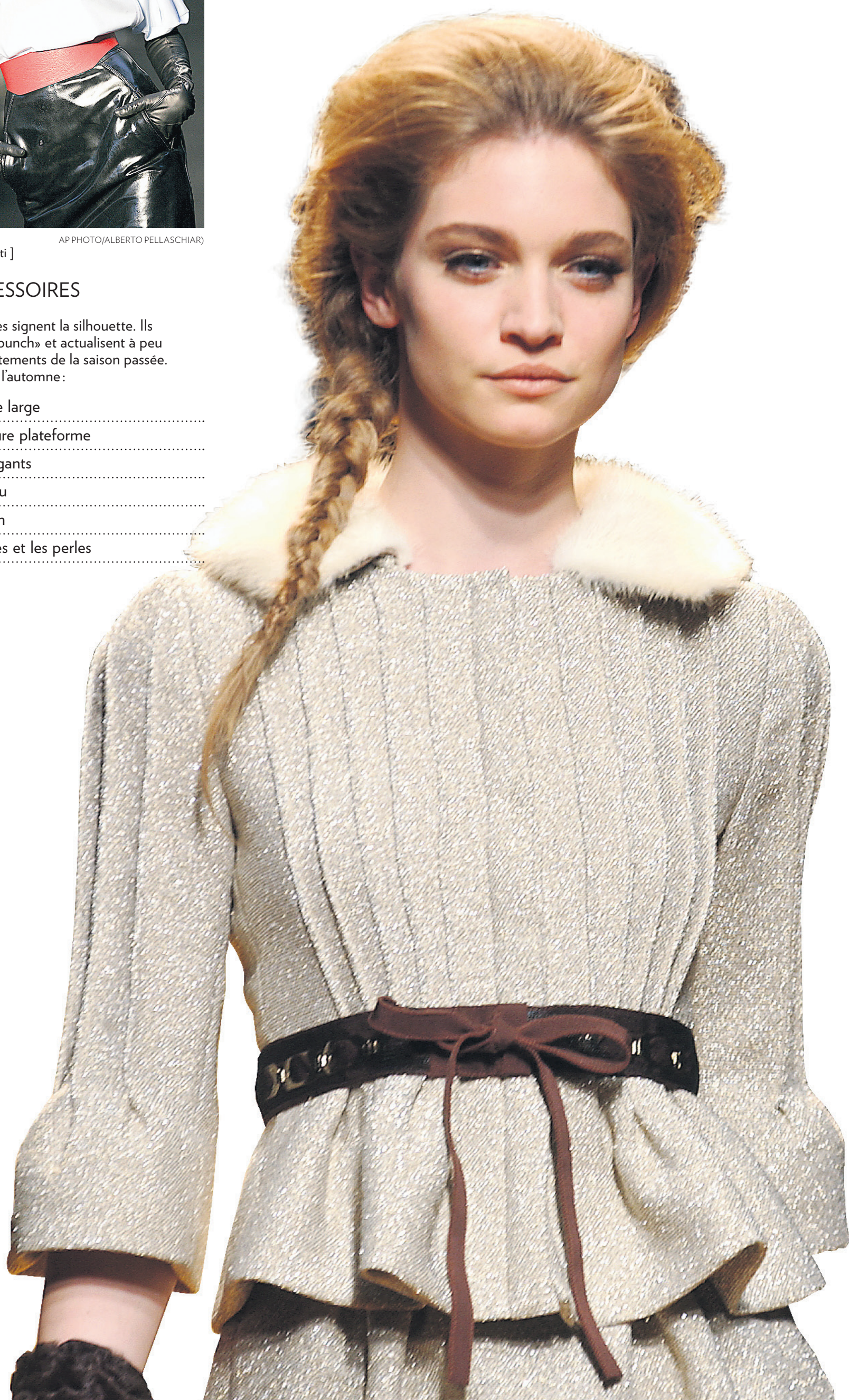
[Alberta Ferretti]