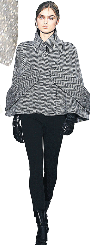
[Paco Rabanne]