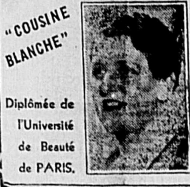
"COUSINE BLANCHE" Diplômée de l'Université de Beauté de PARIS.