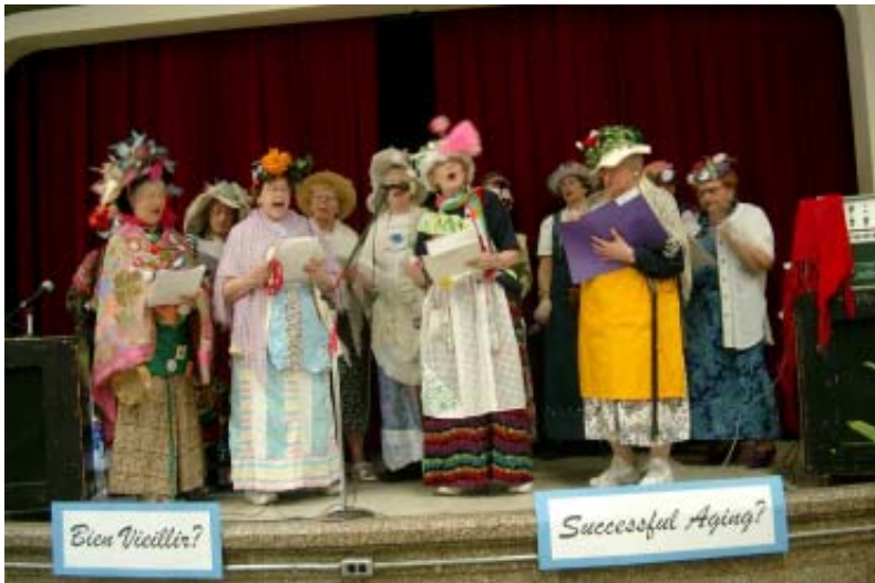
Les mémés déchaînées: un groupe de militantes qui inspirent les générations montantes

On peut rappeler qu'au départ, notre recherche se situait un peu à contre-courant de certaines représentations établies concernant les femmes âgées (Charpentier, 1995 ; Kérisit, 2000) et notamment de ces images négatives qui les concernent (Perrig-Chiello, 2001), comme celle de la «little old lady»: small in stature, fragile, weak» (Grenier et Hanley, 2007 : 213). Ces images persistantes, croyions-nous, entretenaient l'idée que les aînées sont passives et sans pouvoir dans la société, alors que des données nous donnaient plutôt l'intuition que les aînées étaient engagées dans divers mouvements sociaux et y exerçaient une citoyenneté active, solidaire et méconnue (Guillemard, 2002). Nous nous sommes donc proposé d'examiner les pratiques concrètes et formes de militance des aînées, leurs significations et l'influence qu'elles exercent sur les générations montantes. De plus, reconnaissant que le genre détermine l'expérience du vieillissement, notre recherche s'inscrivait dans les tentatives récentes de rapprochements théoriques et pratiques entre les études féministes et la gérontologie. Enfin, l'approche féministe nous apparaissait d'autant plus pertinente qu'elle reconnaît l'importance du vécu et de la parole des femmes, leur subjectivité, en intégrant des dimensions historiques, structurelles et générationnelles.