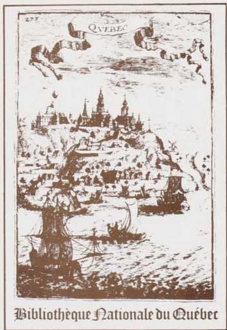
Bibliothèque Nationale du Québec