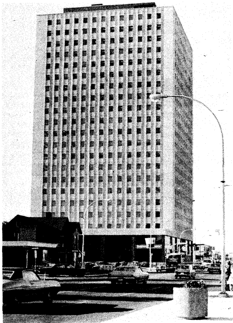
Edifice Vincent Massey, boul. St-Joseph à Hull. Bientôt le français sera la langue de travail dans cet édifice.

demande de brevet au Canada le feront aussi au Québec afin de protéger leurs inventions ou leurs oeuvres littéraires. Son déplacement vers Hull ne posera pas de difficultés car c'est un service qui n'existe pas à l'heure ac-