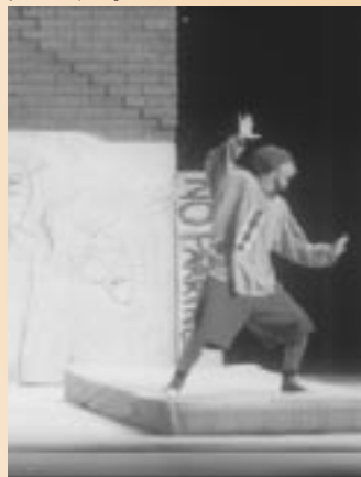
Ti-coune (alias Steve) dans Mur-Mur