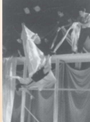
Hubert (alias Steve) suspendu par les pieds dans Lili

Et ce fut la première tournée au Japon : 75 REPRÉSENTATIONS EN 83 JOURS DANS 62 VILLES. C'est là que toute mon histoire avec DynamO Théâtre a commencé. Cette tournée-là va rester marquée à jamais, pas seulement parce qu'elle a été difficile, mais parce que ce fut une première expérience pour moi de jouer devant des salles de deux ou trois mille enfants. Je me rappelle les rires des enfants qui faisaient une vague dans la salle tellement elle était grande. La vague commençait en avant, se déplaçait à l'arrière et revenait. Au Japon, il y a des enfants qui venaient dans le décor. Le spectacle arrêtait, on prenait les enfants et on les replaçait dans la salle.